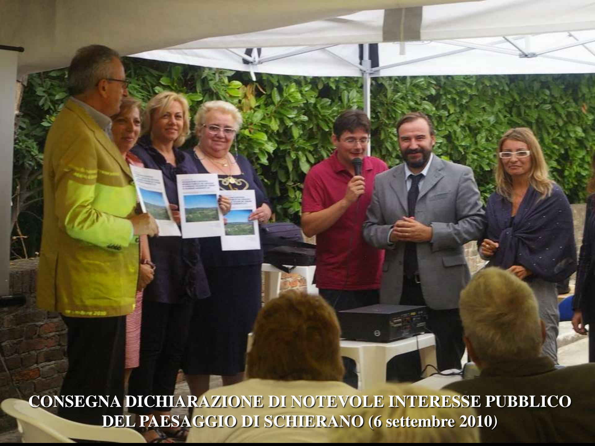
CONSEGNA DICHIARAZIONE DI NOTEVOLE INTERESSE PUBBLICO DEL PAESAGGIO DI SCHIERANO (6 settembre 2010)