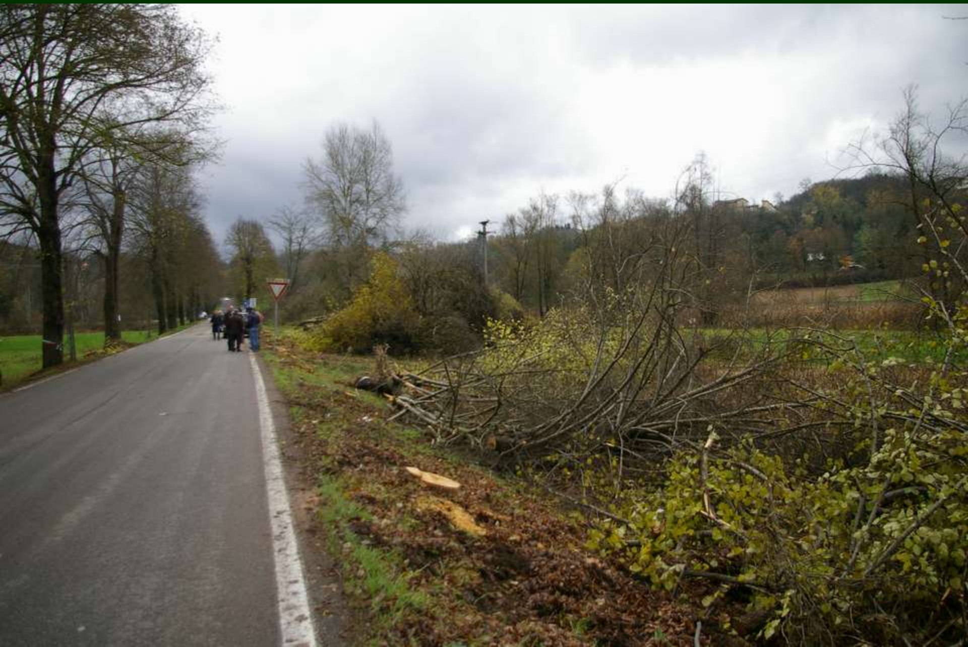
Alberi abbattuti lungo il viale di Montafia (venerdì 21 novembre 2013)