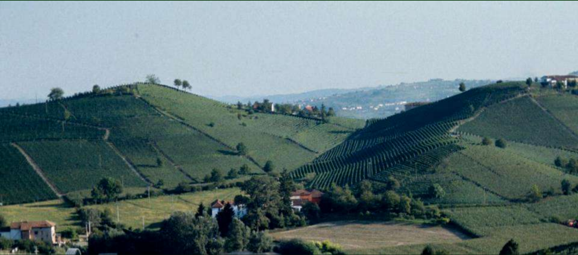
Vallata tra San Marzanotto e Mongardino