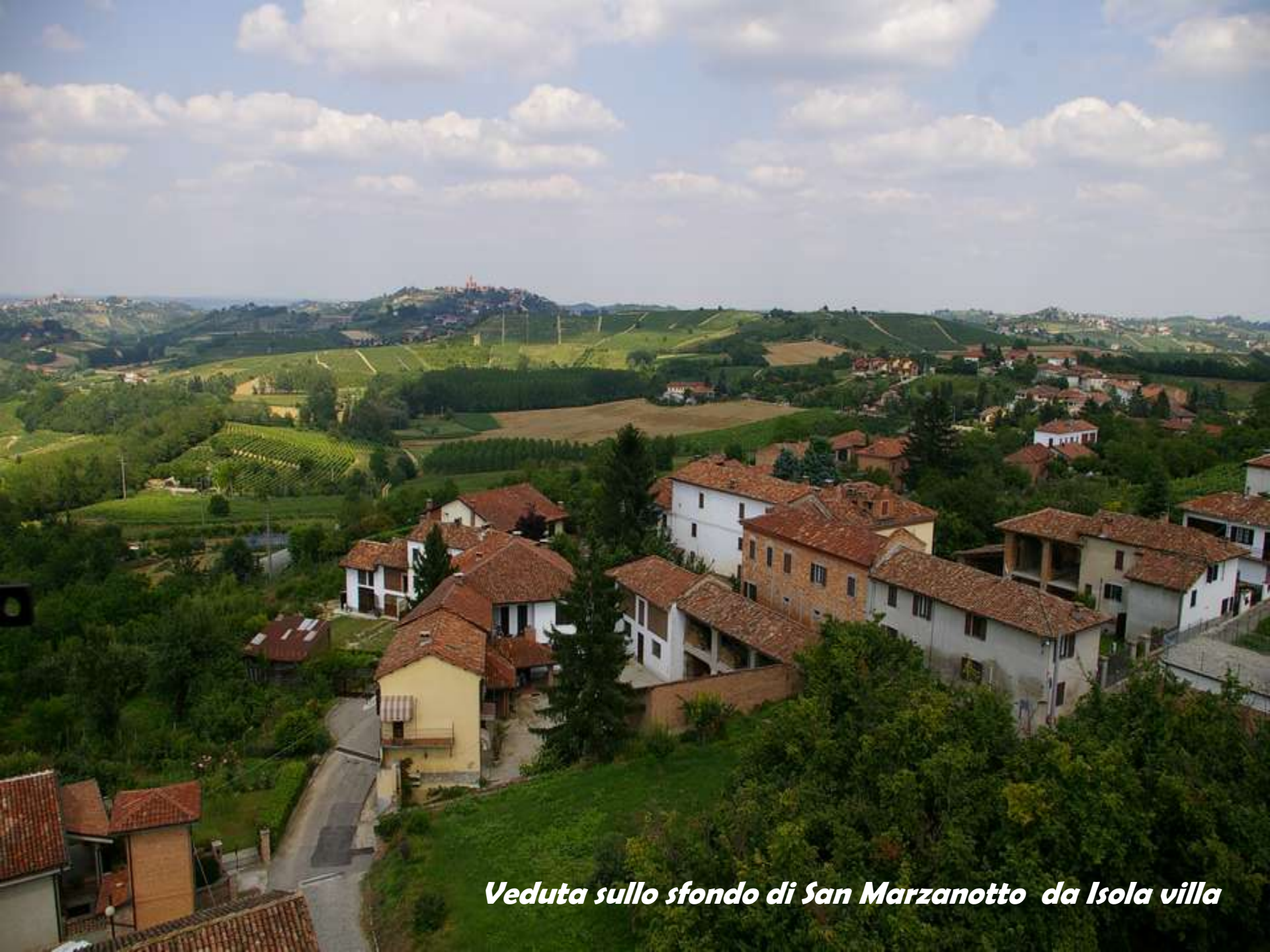
Veduta sullo sfondo di San Marzanotto da Isola villa