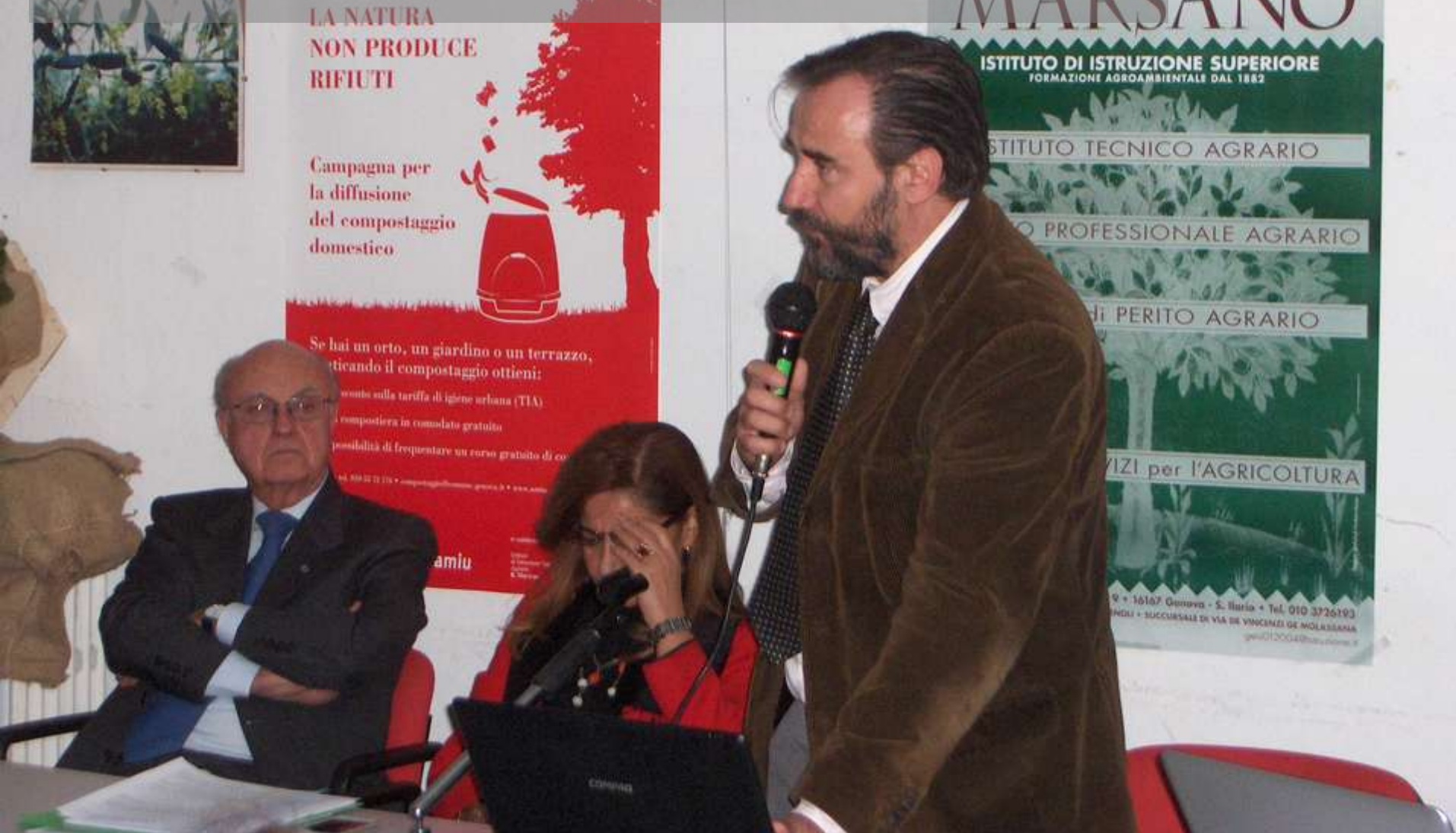
Convegno sul Codice Urbani, con l'ex Ministro Giuliano URBANI a Sant'Ilario (GE) 24 gennaio 2013