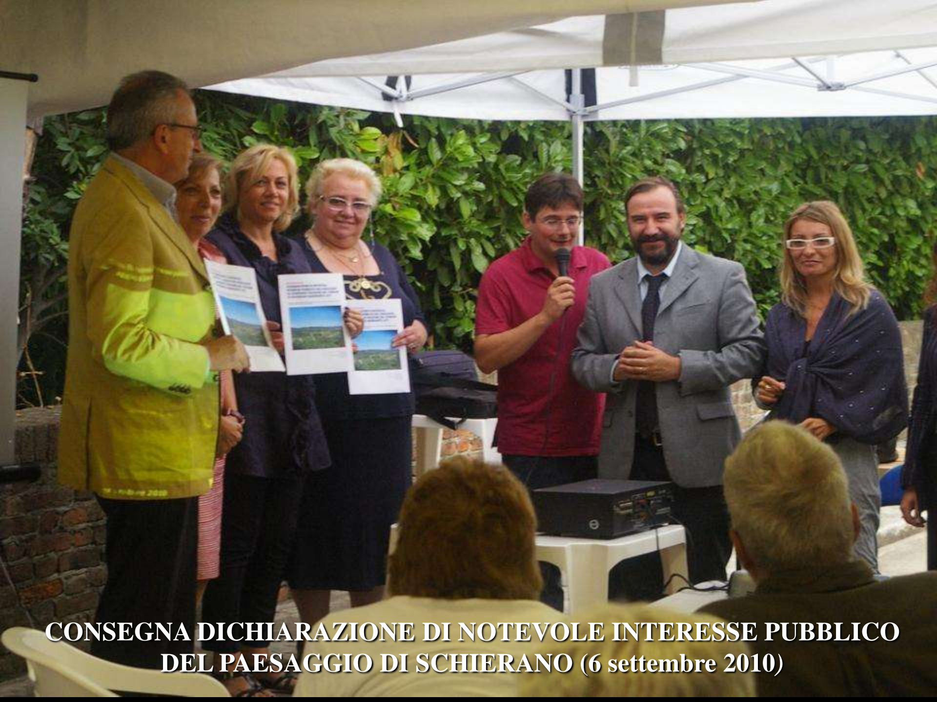
CONSEGNA DICHIARAZIONE DI NOTEVOLE INTERESSE PUBBLICO DEL PAESAGGIO DI SCHIERANO (6 settembre 2010)