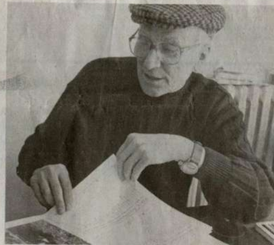
Bartolo Mascarello, figura storica del Barolo