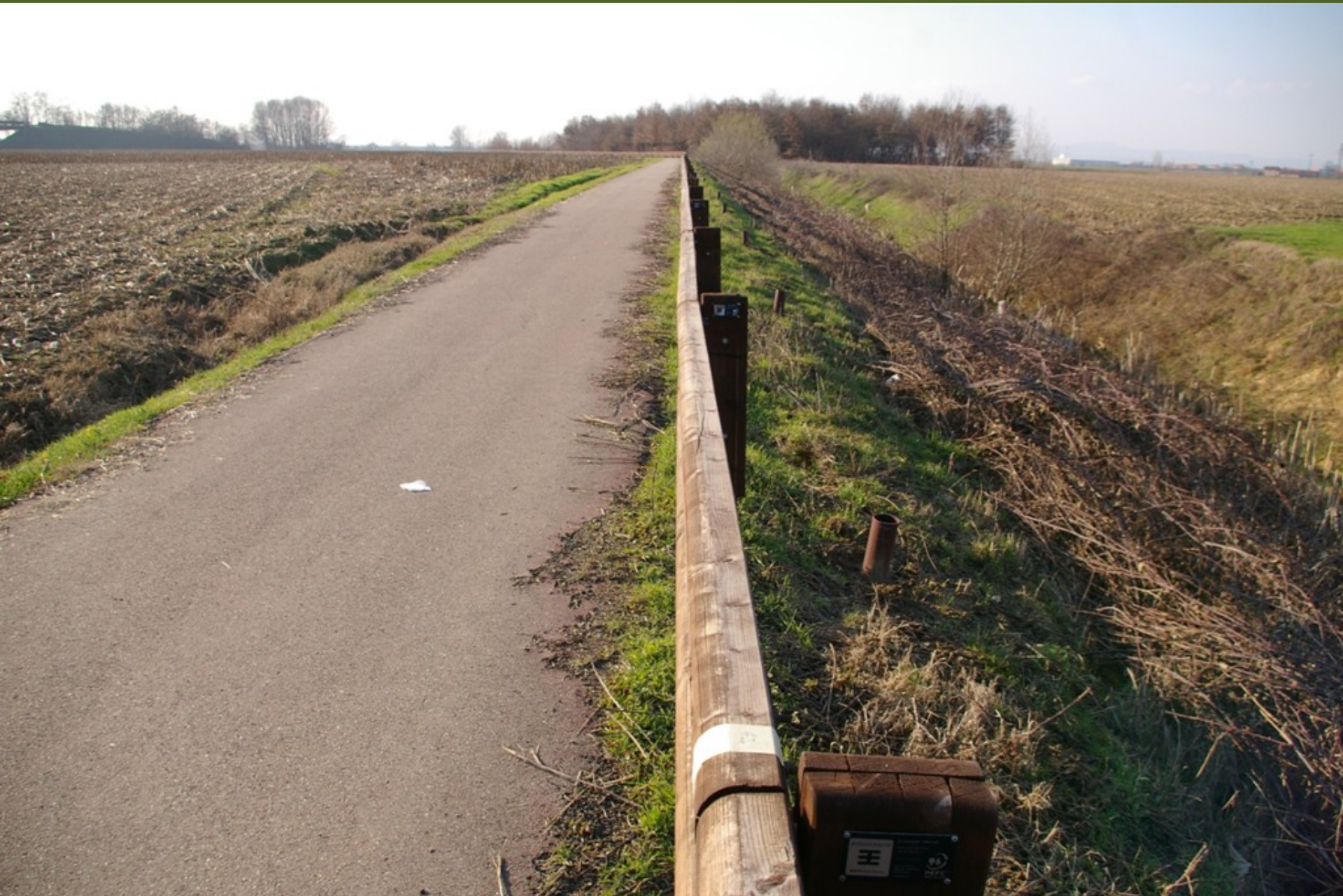
Nastro adesivo in carta posizionato sul guard rail in corrispondenza dei siti di piantagione dei tigli