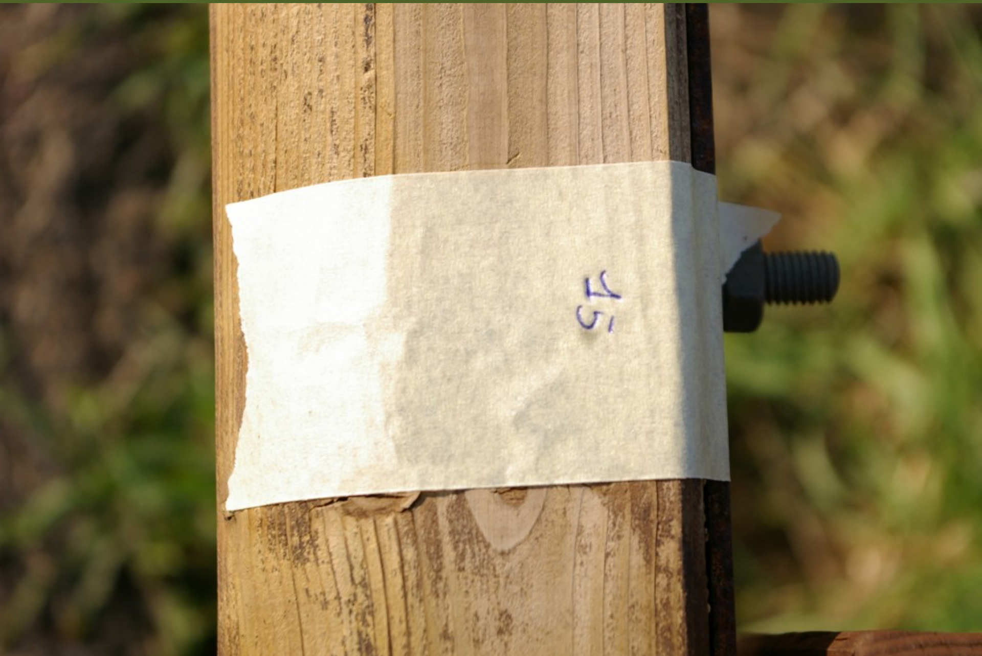
Nastro adesivo in carta posizionato sul guard rail in corrispondenza dei siti di piantagione dei tigli