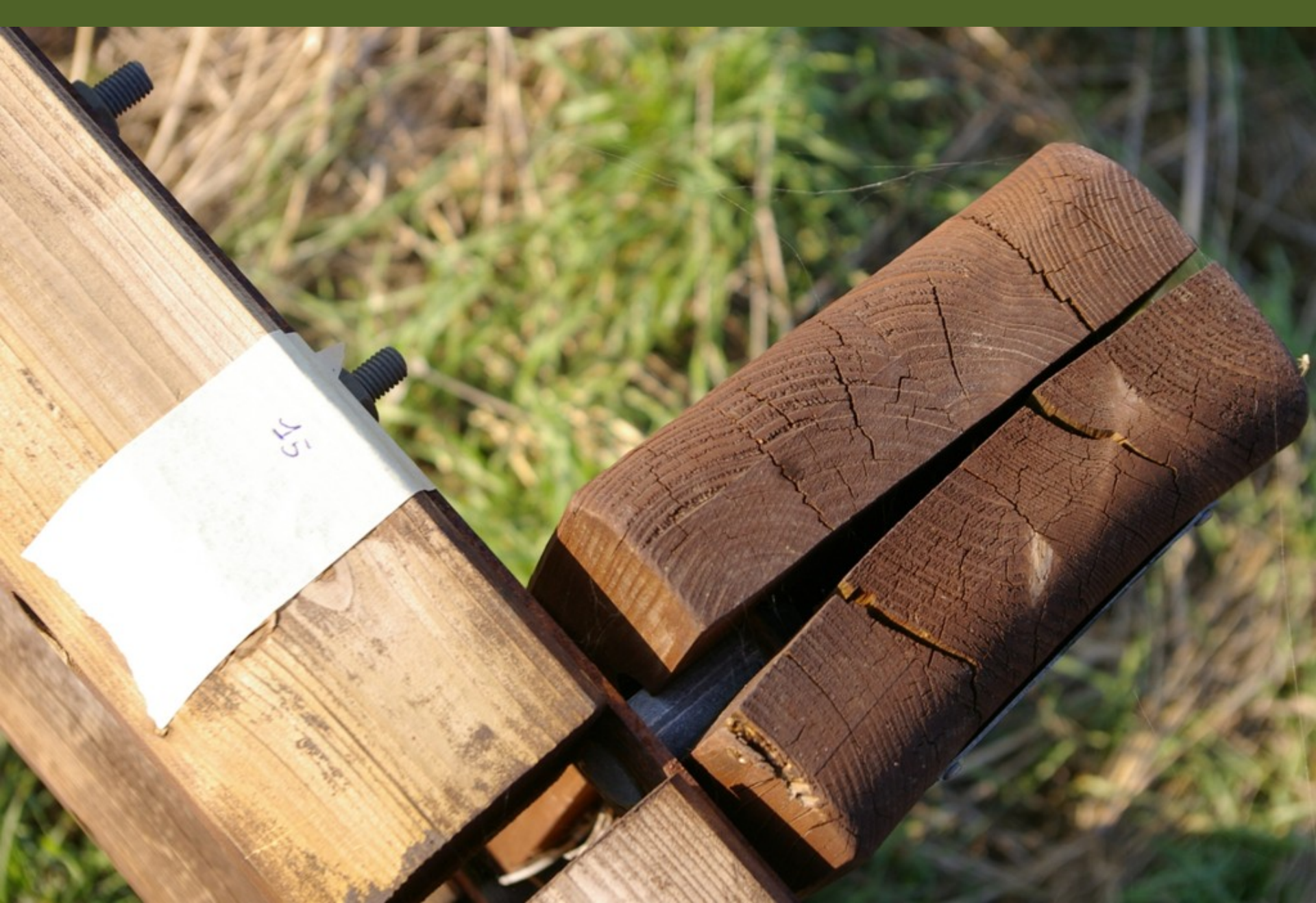
Nastro adesivo in carta posizionato sul guard rail in corrispondenza dei siti di piantagione dei tigli