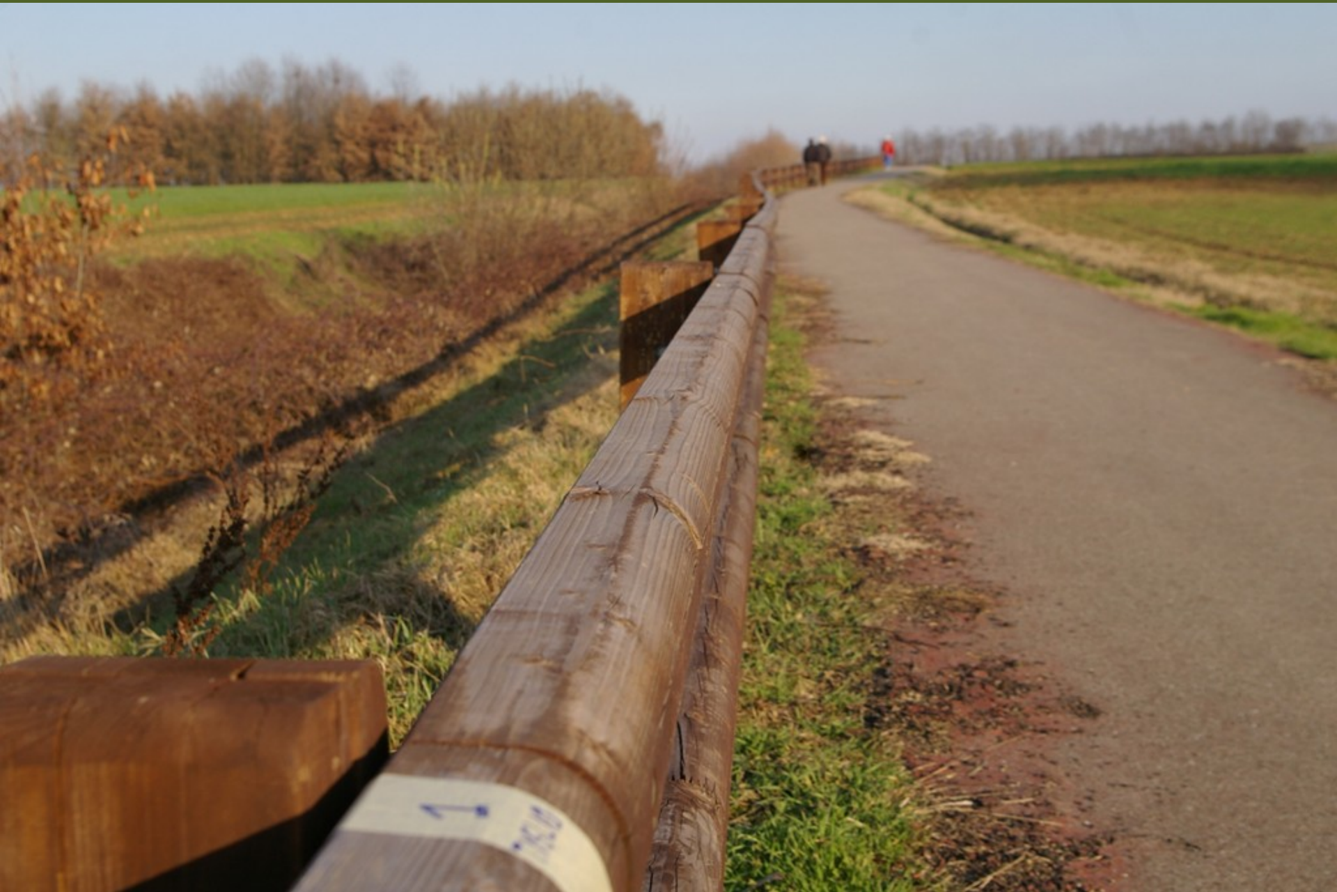
Nastro adesivo in carta posizionato sul guard rail in corrispondenza dei siti di piantagione dei tigli