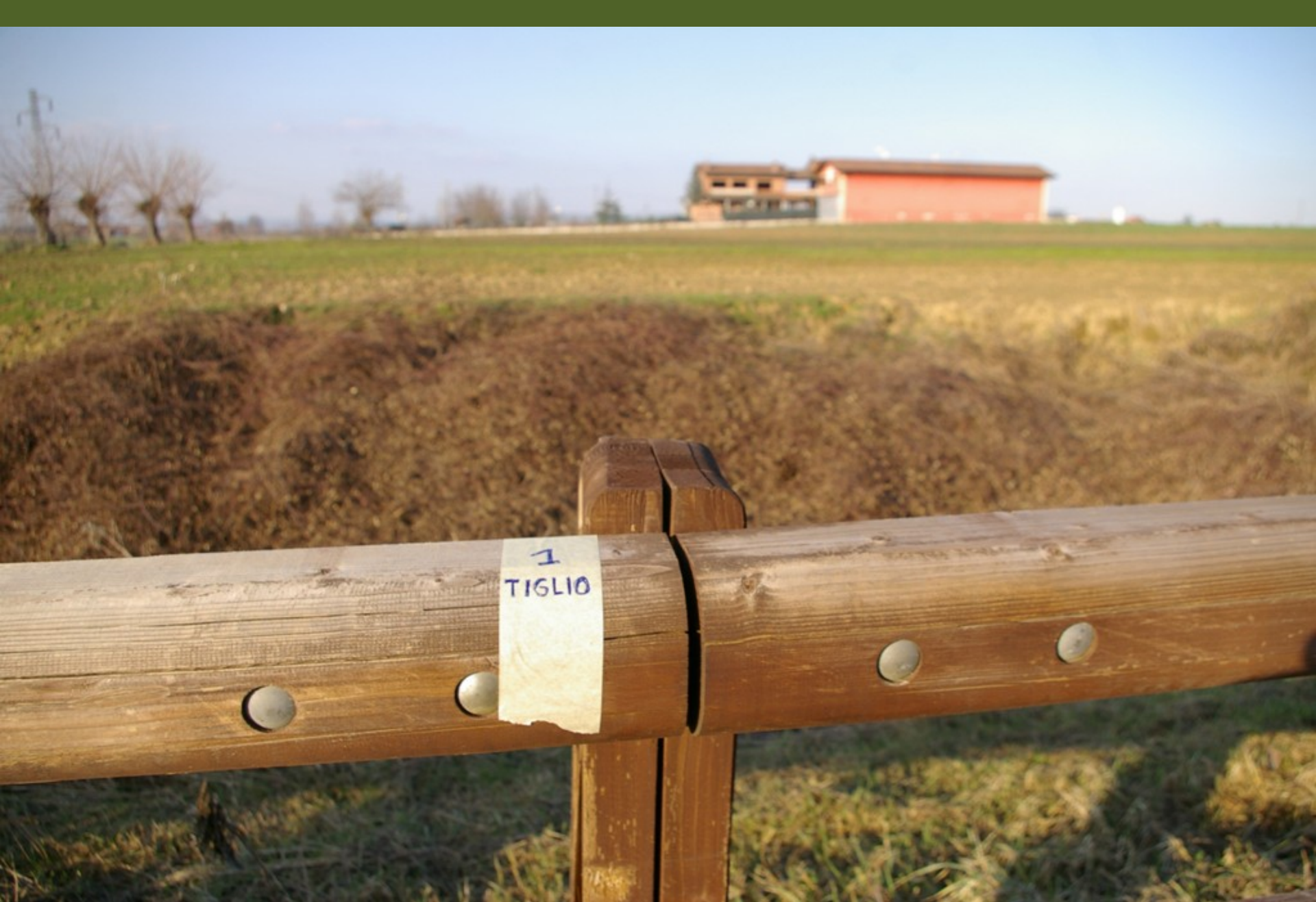
Nastro adesivo in carta posizionato sul guard rail in corrispondenza dei siti di piantagione dei tigli