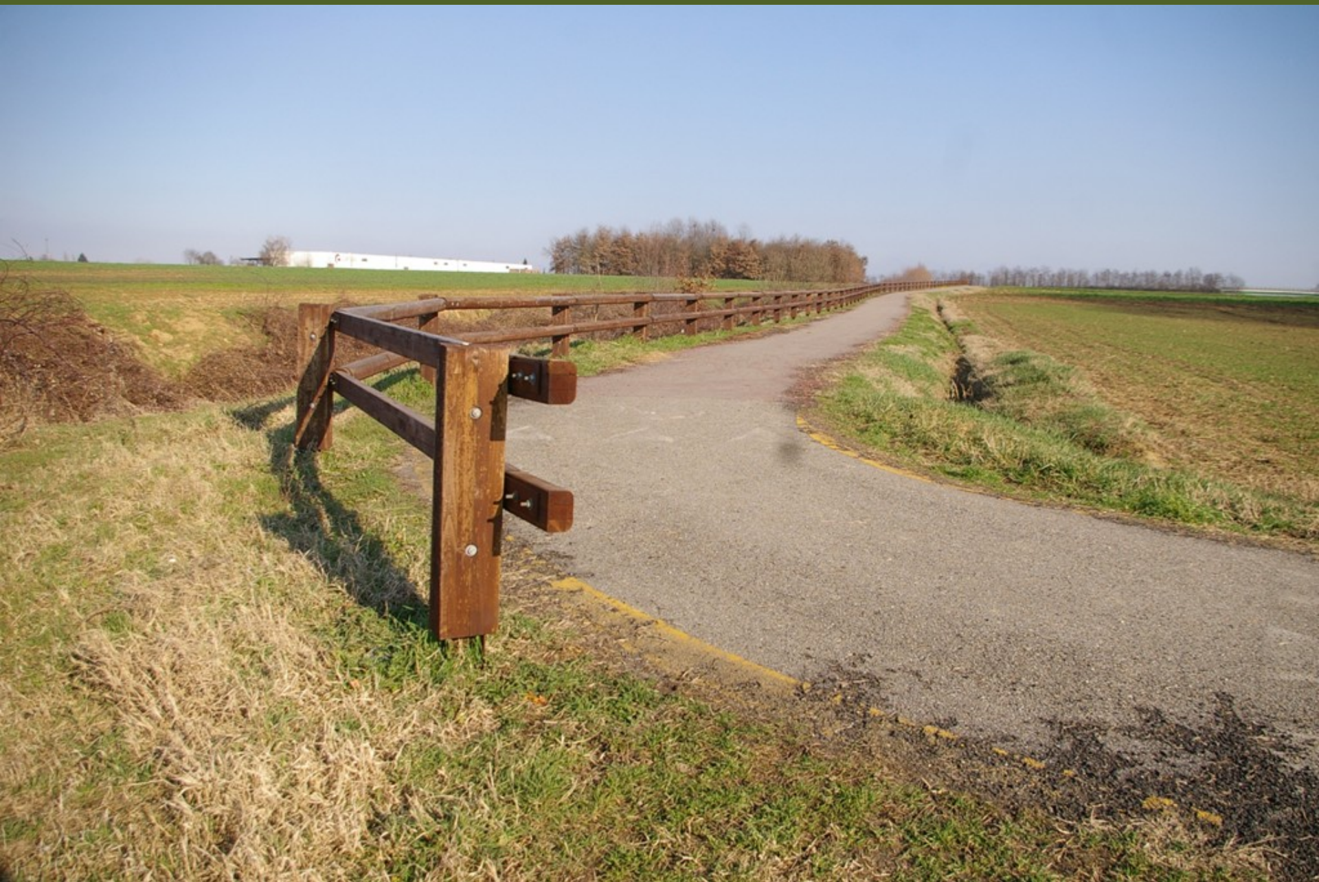
Veduta d'insieme della pista ciclabile di Villanova d'Asti