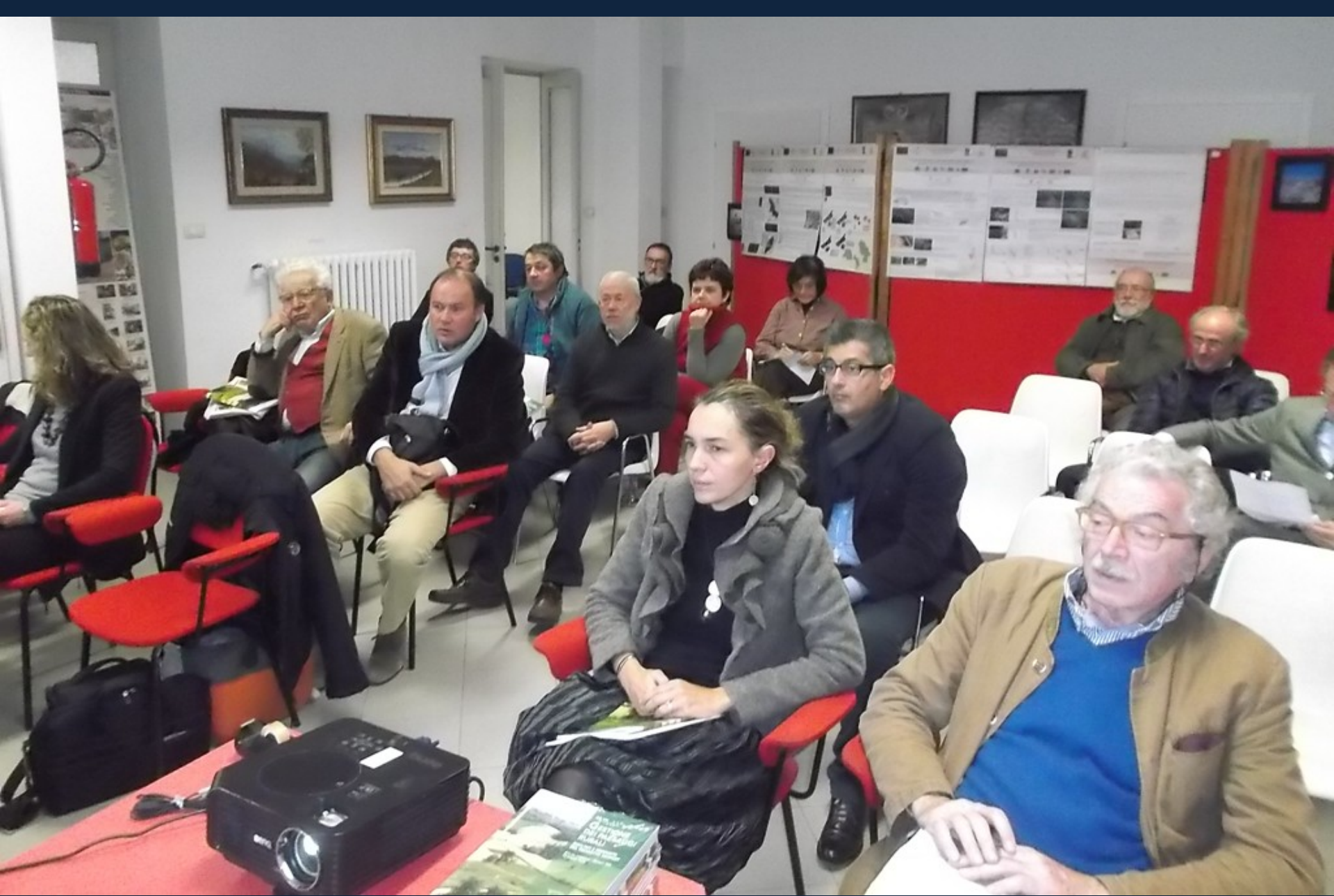
Pubblico presente al Convegno su "Gestione dei paesaggi rurali. Risultati e proposte del progetto GESPART"