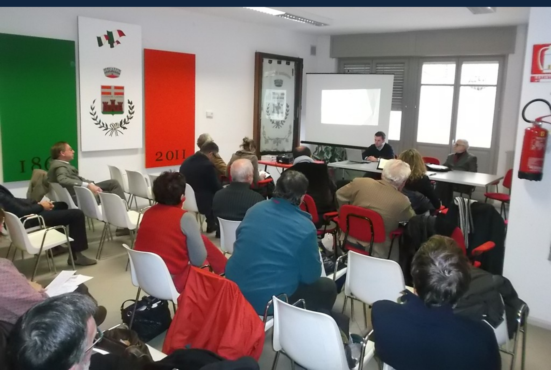
Relazione dell'Arch. Fabrizio Aimar su "Analisi delle trasformazioni degli usi dei suoli su base storica e catastale: il caso studio di Mongardino"