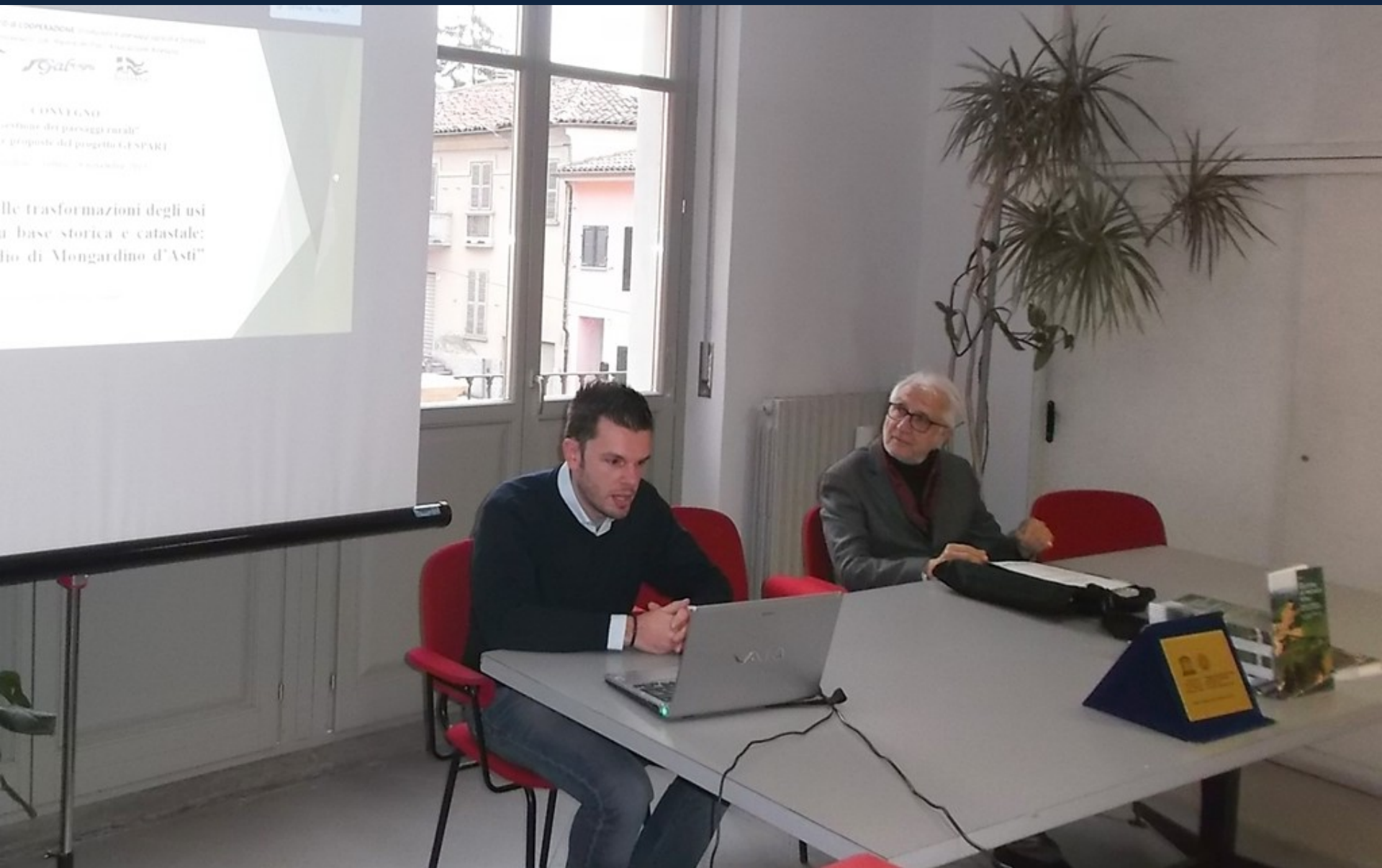
Relazione dell'Arch. Fabrizio Aimar su "Analisi delle trasformazioni degli usi dei suoli su base storica e catastale: il caso studio di Mongardino"