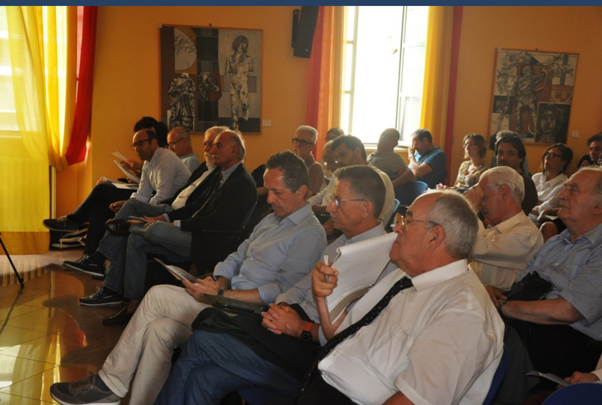
Veduta del folto ed interessato pubblico presente al Convegno su “La nuova legge sul contenimento del consumo di suolo: considerazioni e linee di indirizzo del settore agronomico”