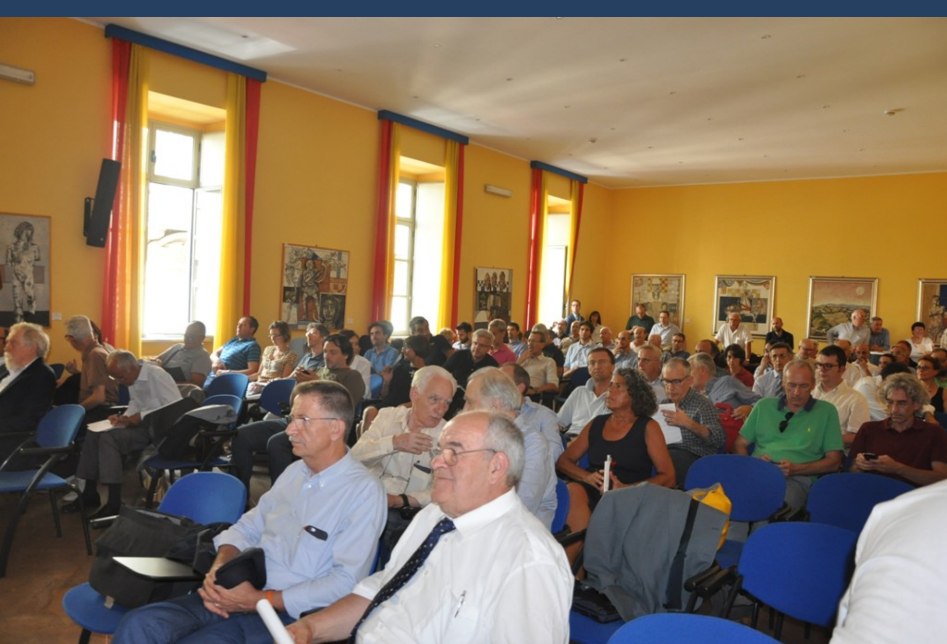
Veduta del folto ed interessato pubblico presente al Convegno su “La nuova legge sul contenimento del consumo di suolo: considerazioni e linee di indirizzo del settore agronomico”