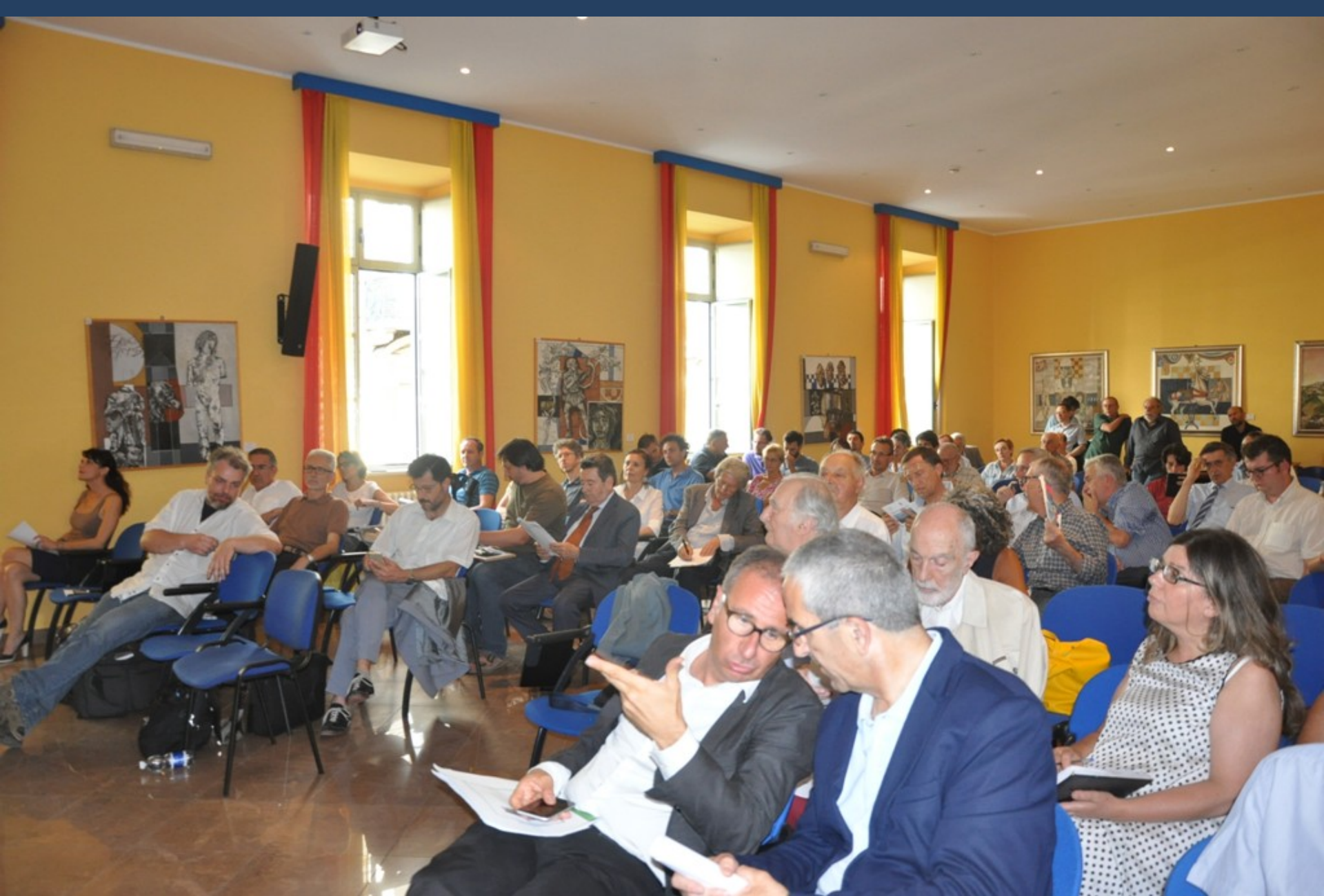
Veduta del folto ed interessato pubblico presente al Convegno su “La nuova legge sul contenimento del consumo di suolo: considerazioni e linee di indirizzo del settore agronomico”