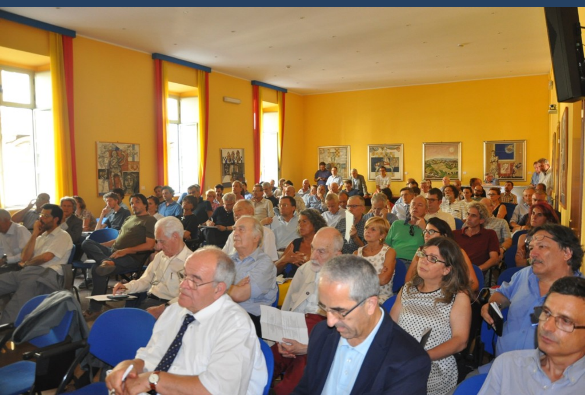
Veduta del folto ed interessato pubblico presente al Convegno su “La nuova legge sul contenimento del consumo di suolo: considerazioni e linee di indirizzo del settore agronomico”