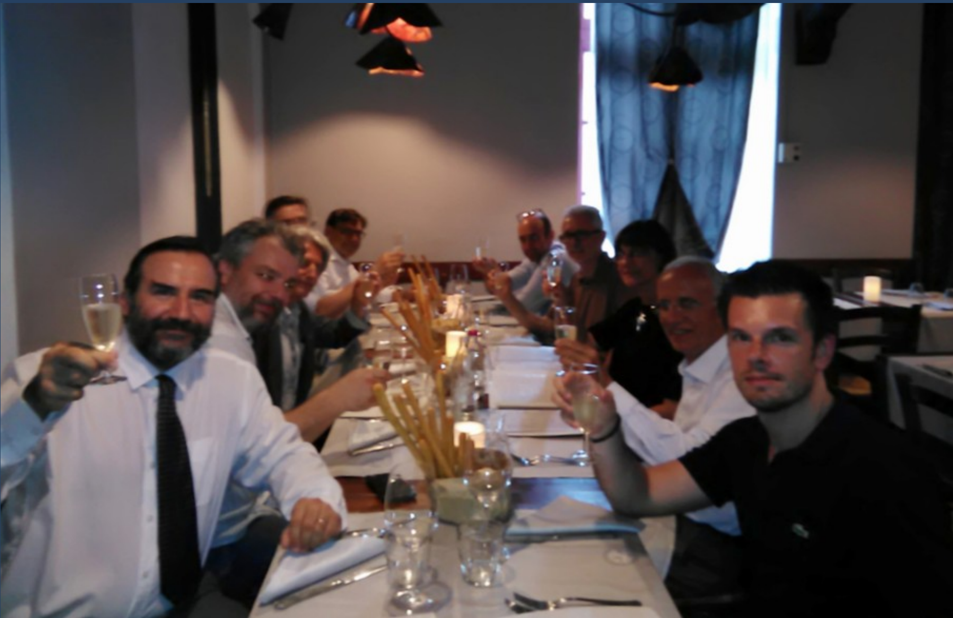
Brindisi in occasione di un momento conviviale con i relatori al termine dei lavori del Convegno