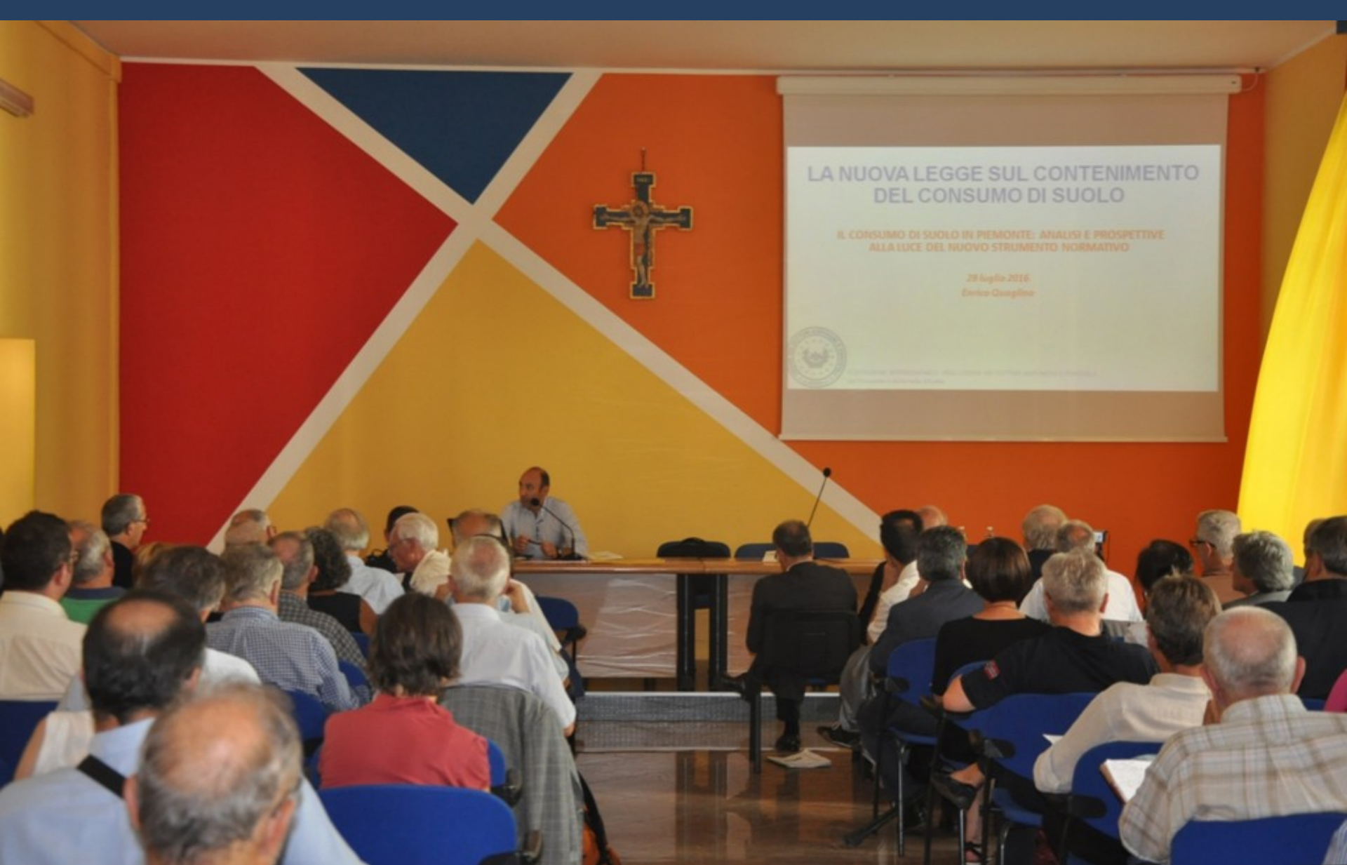
Relazione del Dott. For. Enrico Quaglino (Agronomo libero professionista – Ordine dei Dottori agronomi e Dottori forestali della Provincia di Torino) su “Il consumo di suolo in Piemonte: analisi e prospettive alla luce del nuovo strumento normativo”