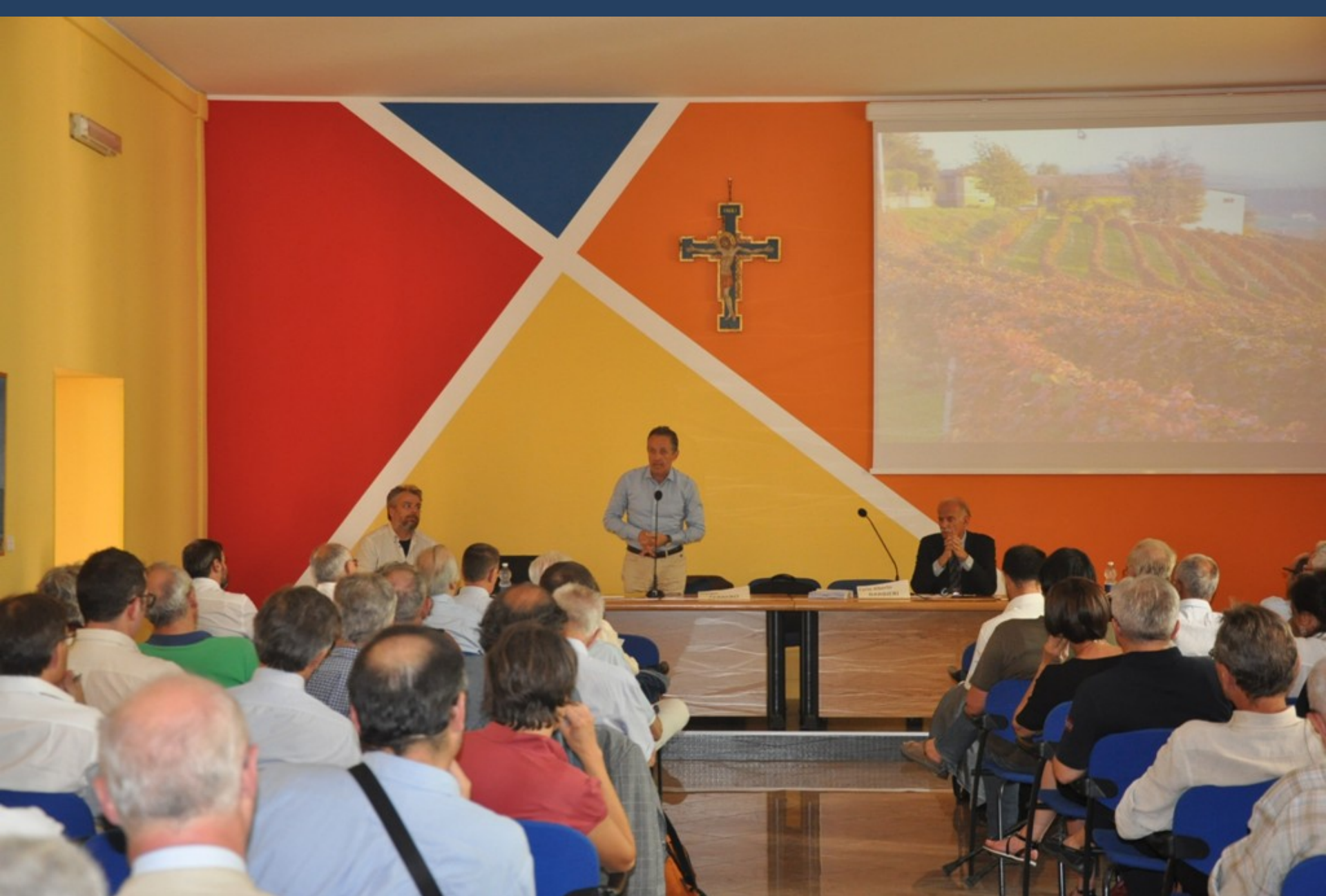
Saluto introduttivo da parte dell'Agr. Giorgio Ferrero (Assessore all'Agricoltura della Regione Piemonte)