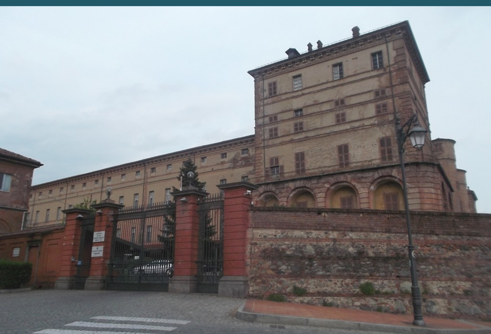
Veduta del Castello di Moncalieri sede del Convegno "Dai giardini nobiliari alle ville signorili e al verde pubblico. Arte, Mode, Valorizzazione"