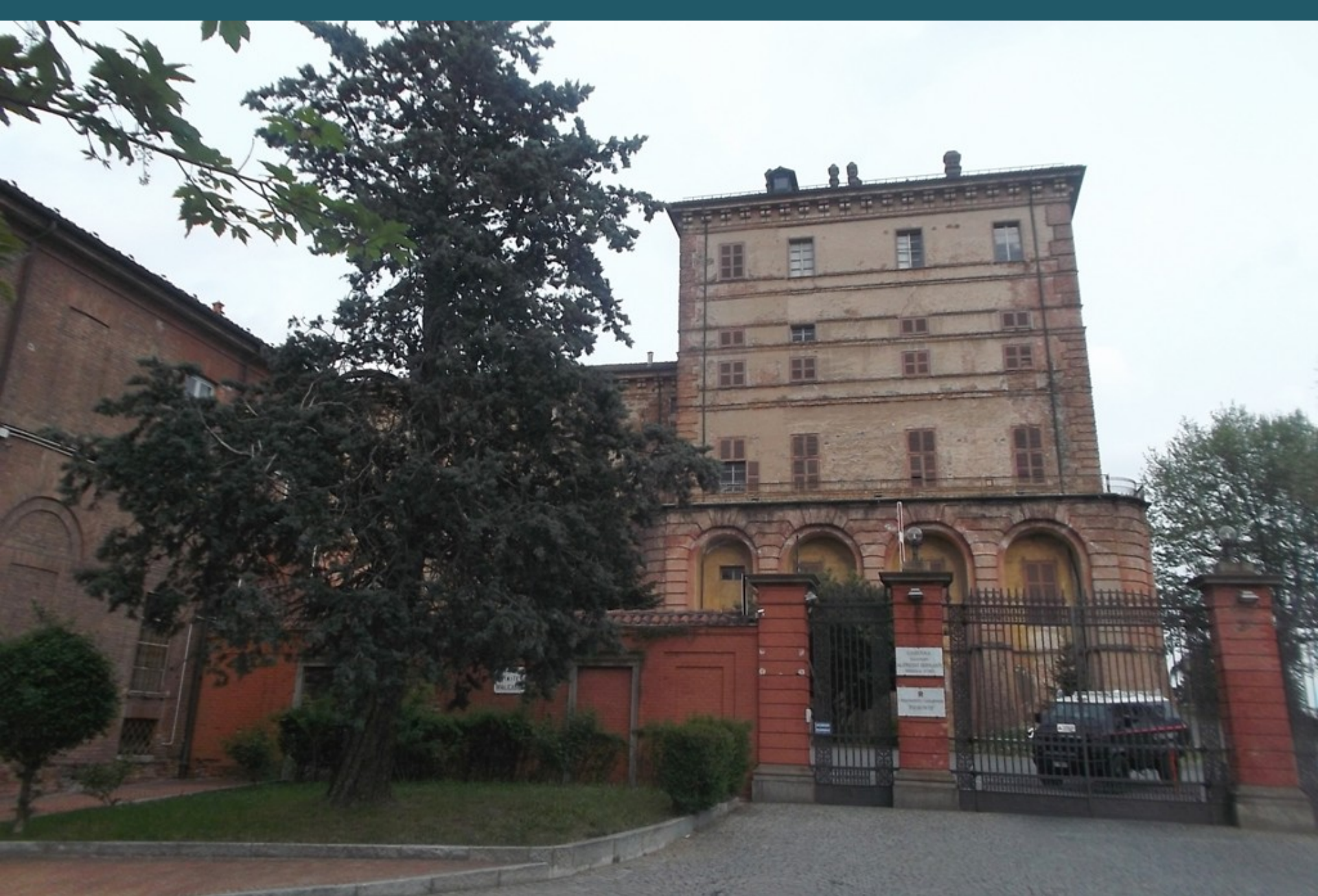
Veduta del Castello di Moncalieri sede del Convegno "Dai giardini nobiliari alle ville signorili e al verde pubblico. Arte, Mode, Valorizzazione"