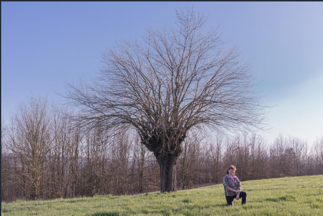
Veduta del famosissimo bialbero di Villafranca d'Asti, costituito da un gelso ( Morus alba ) al cui interno si è insediato un ciliegio ( Prunus avium )