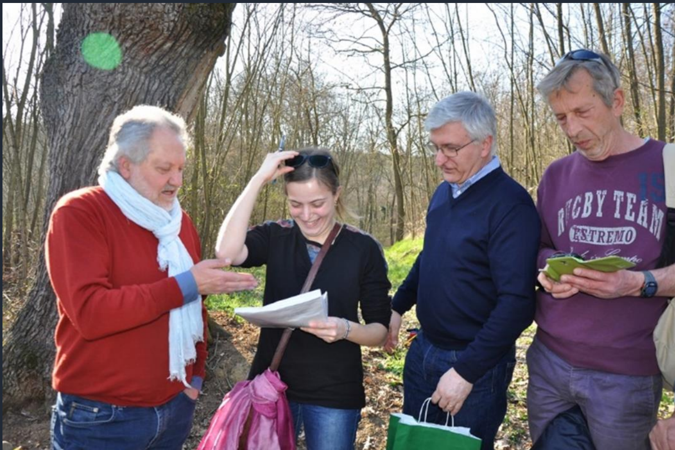
Compilazione della Scheda per la richiesta di riconoscimento del valore monumentale dell'albero ai sensi della Legge 10 del 2013