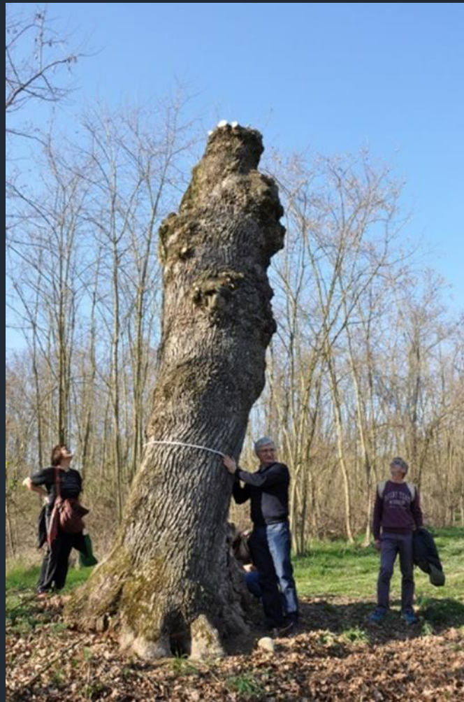
Misurazione della circonferenza del fusto dell'albero monumentale all'altezza canonica del petto d'uomo