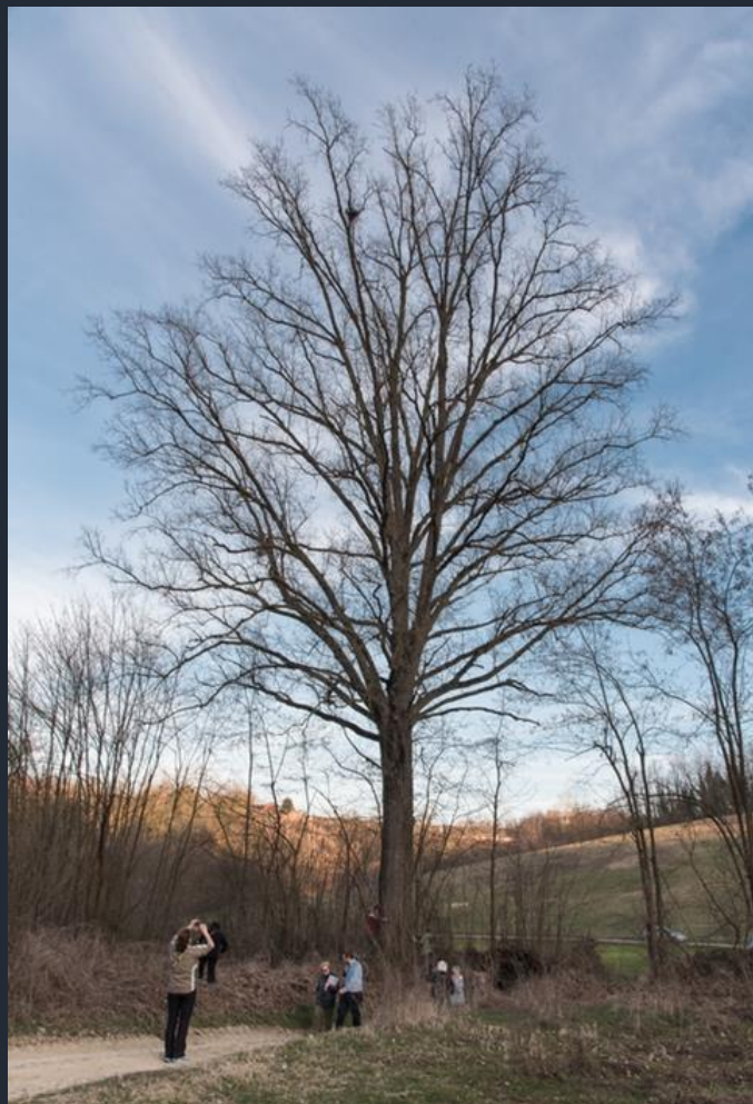
Veduta della straordinaria Farnia di Ferrere d'Asti