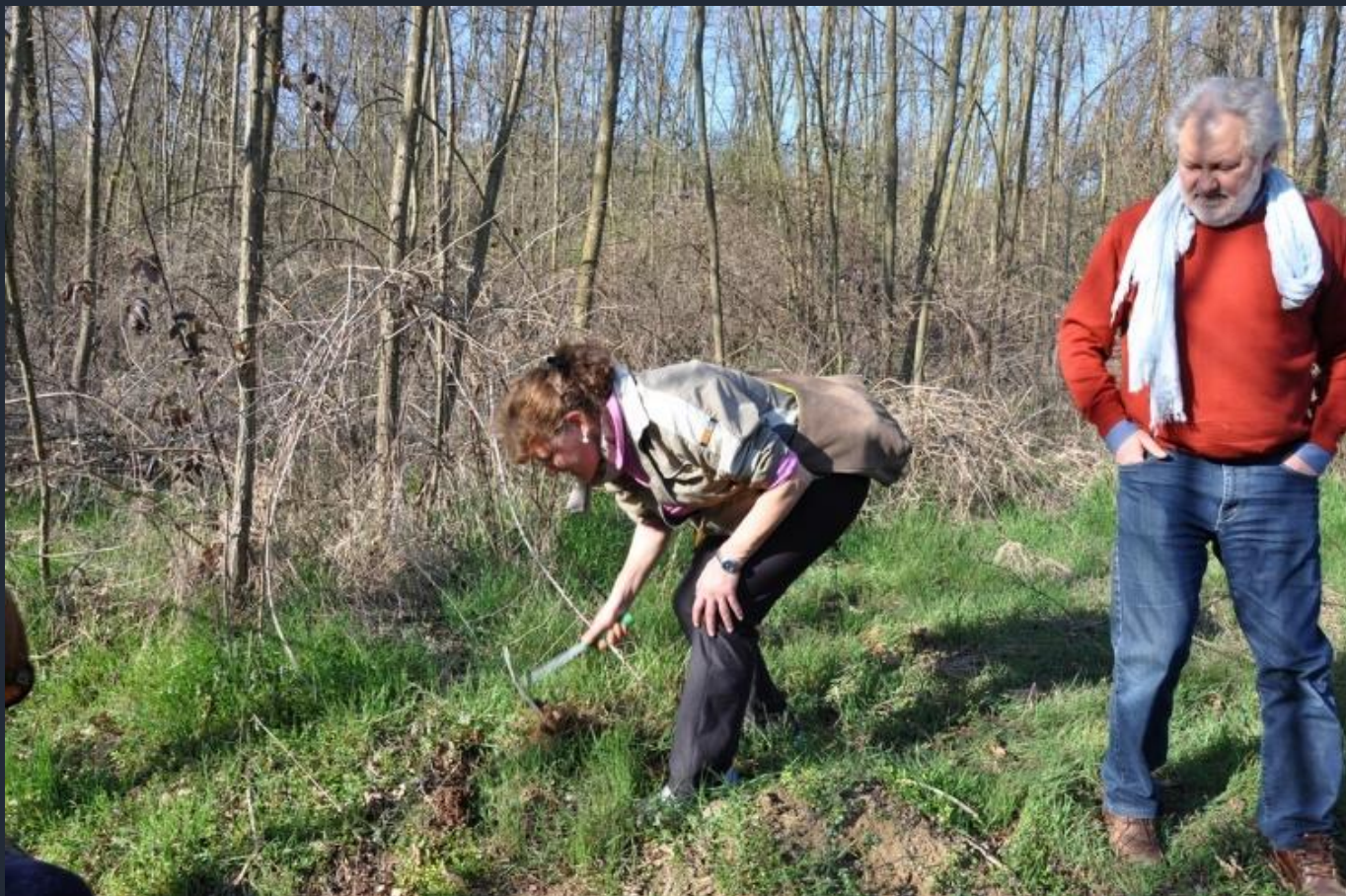
Predisposizione di una buca per l'interramento di una ghianda della Quercia (Quercus robur)