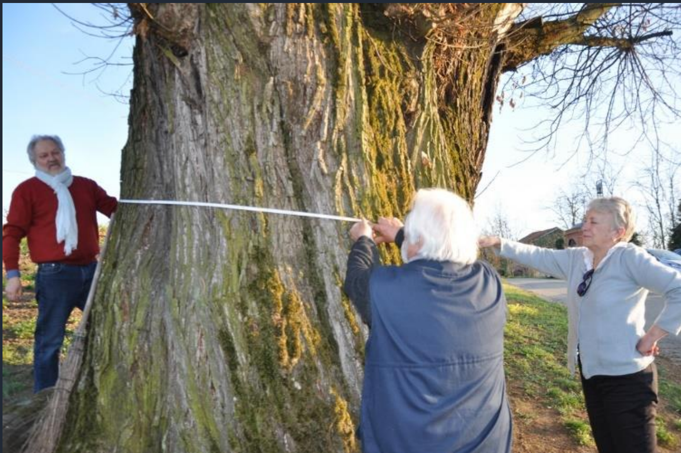
Effettuazione delle operazioni di misurazione del fusto del Castagno monumentale ( Castanea sativa ) di Ferrere d'Asti