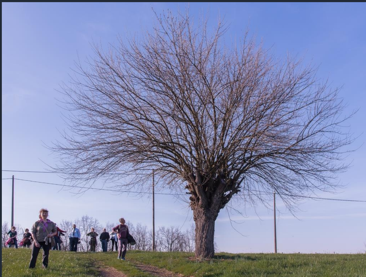
Veduta del famosissimo bialbero di Villafranca d'Asti, costituito da un gelso ( Morus alba ) al cui interno si è insediato un ciliegio ( Prunus avium )