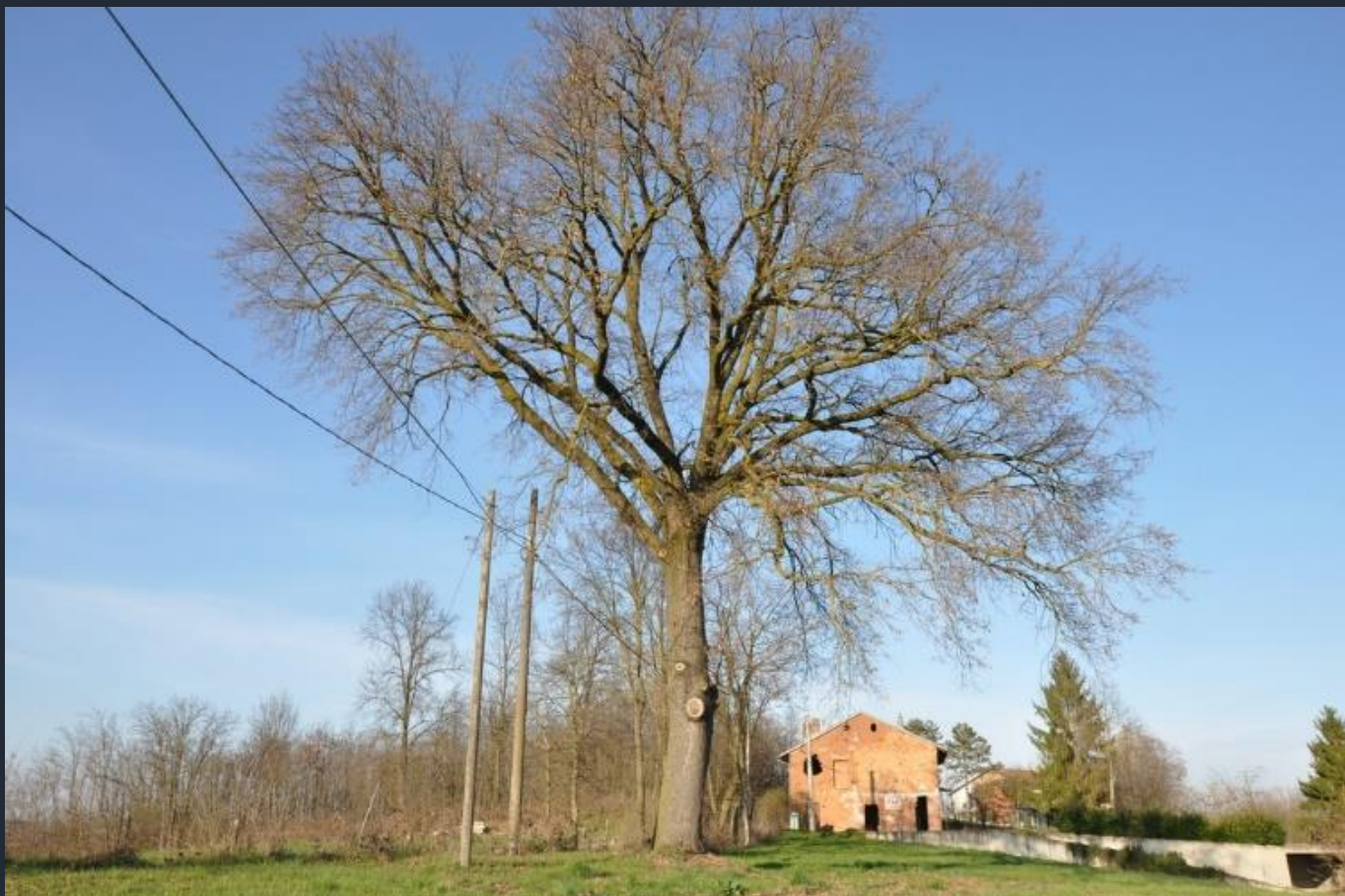
Veduta di un esemplare monumentale di Farnia (Quercus robur) presente nel comune di Villafranca d'Asti