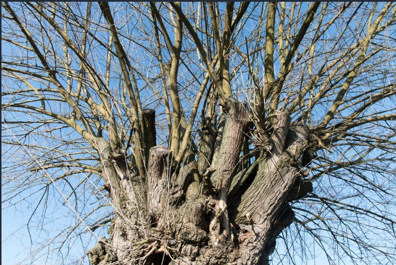
Veduta del famosissimo bialbero di Villafranca d'Asti, costituito da un gelso ( Morus alba ) al cui interno si è insediato un ciliegio ( Prunus avium )