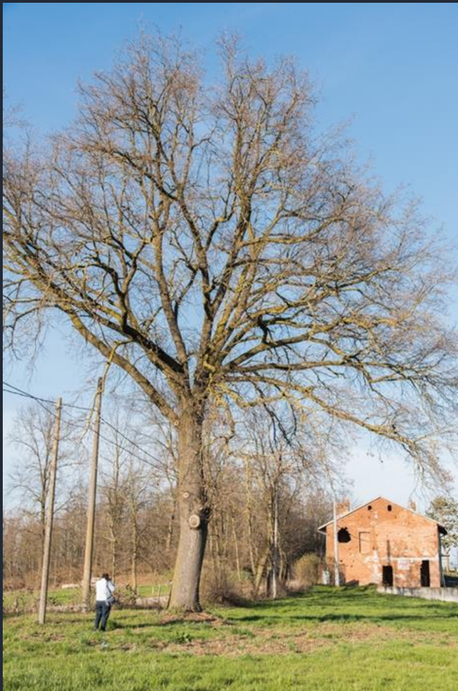
Veduta di un esemplare monumentale di Farnia (Quercus robur) presente nel comune di Villafranca d'Asti