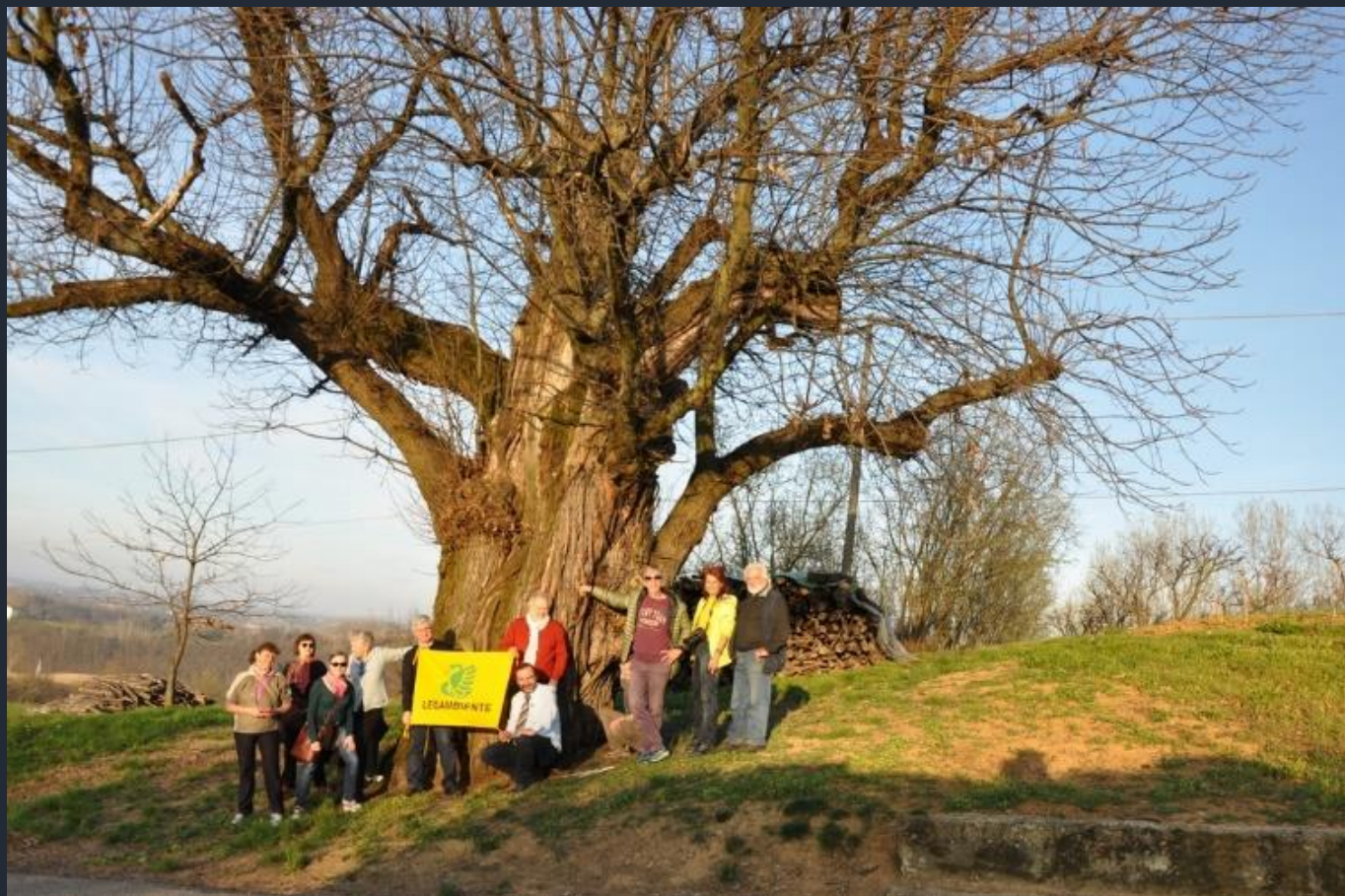
Foto ricordo davanti al plurisecolare castagno di dimensioni eccezionali presente nelle campagne di Ferrere d'Asti