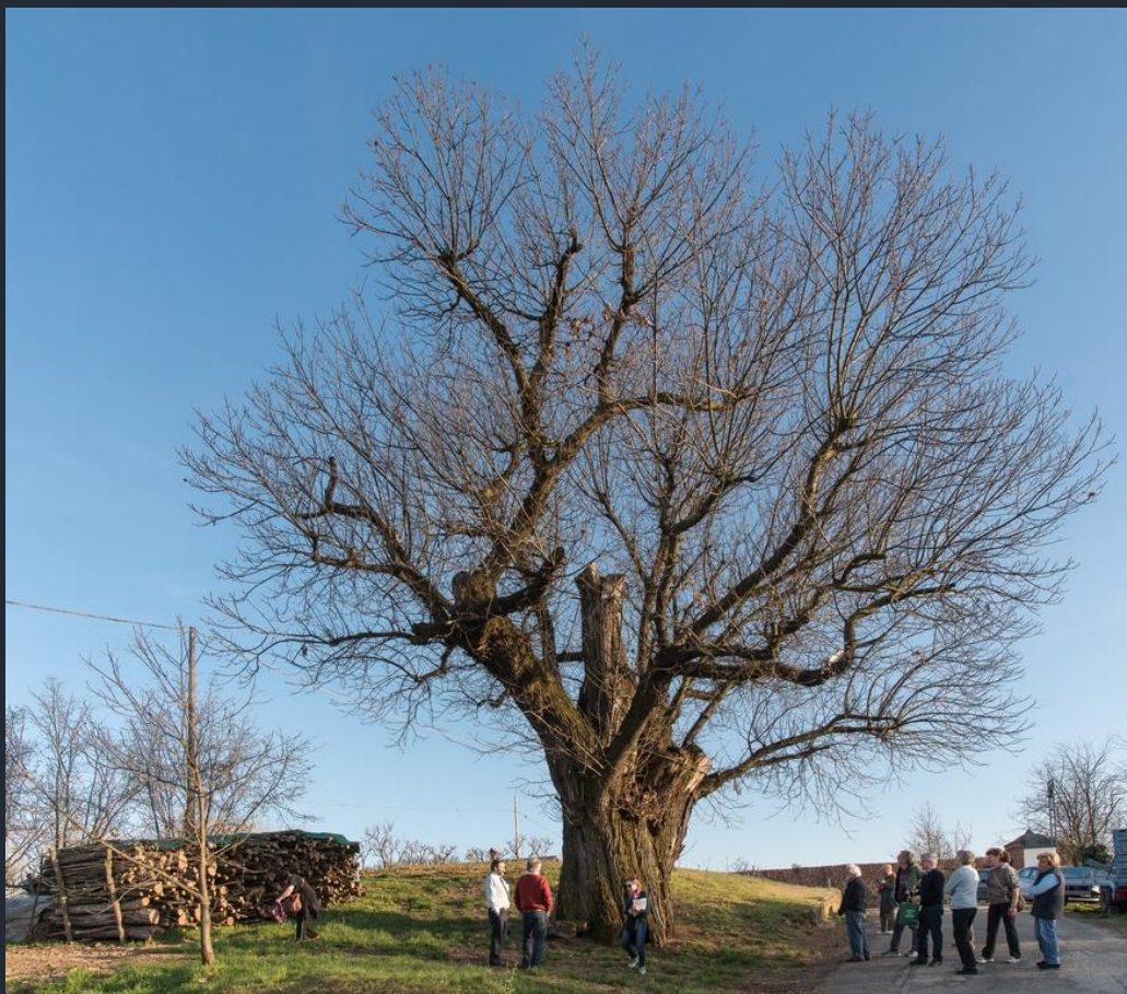
Veduta d'insieme del Castagno monumentale di Ferrere