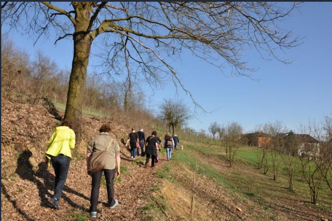
Camminata alla ricerca degli alberi monumentali nel paesaggio agrario del nord ovest dell'Astigiano