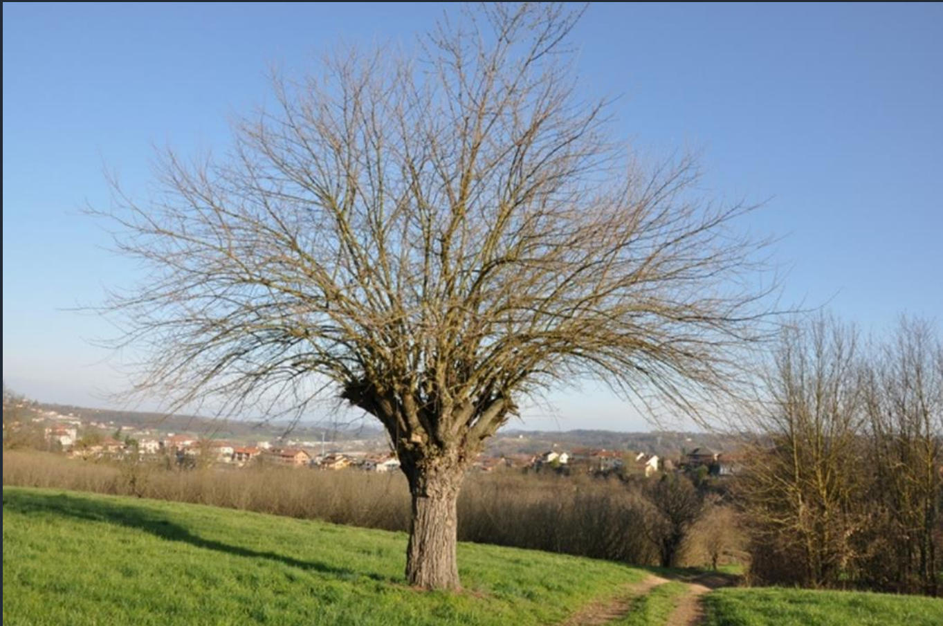
Veduta del famosissimo bialbero di Villafranca d'Asti, costituito da un gelso ( Morus alba ) al cui interno si è insediato un ciliegio ( Prunus avium )