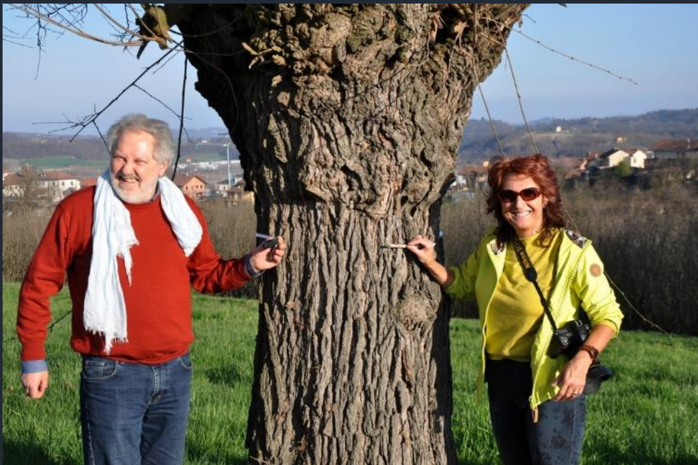
Misurazione della circonferenza del fusto del gelso per la compilazione della scheda di richiesta di dichiarazione del valore monumentale dell'albero