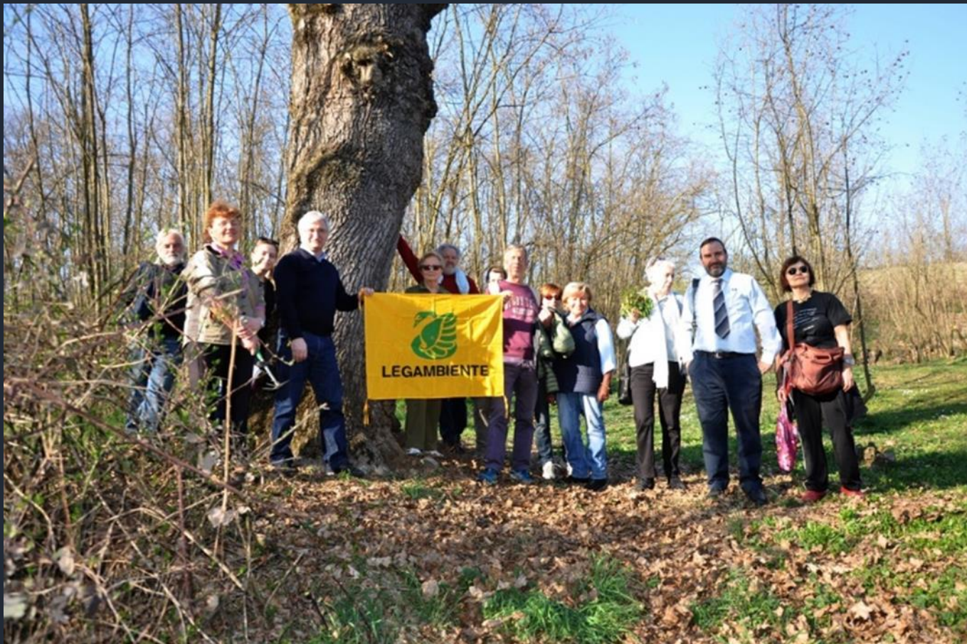
Foto ricordo con tutti i partecipanti con la bandiera di Legambiente al termine della schedatura della Quercia di Villafranca d'Asti per l'avvio del procedimento di dichiarazione del valore monumentale dell'albero ai sensi della Legge 10 del 2013