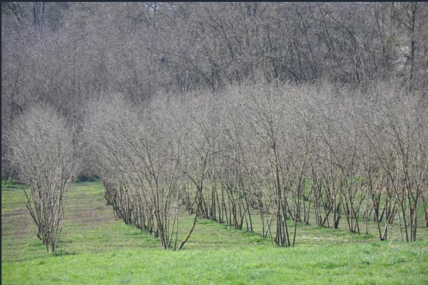
Veduta del paesaggio agrario di Villafranca d'Asti (Noccioleti)