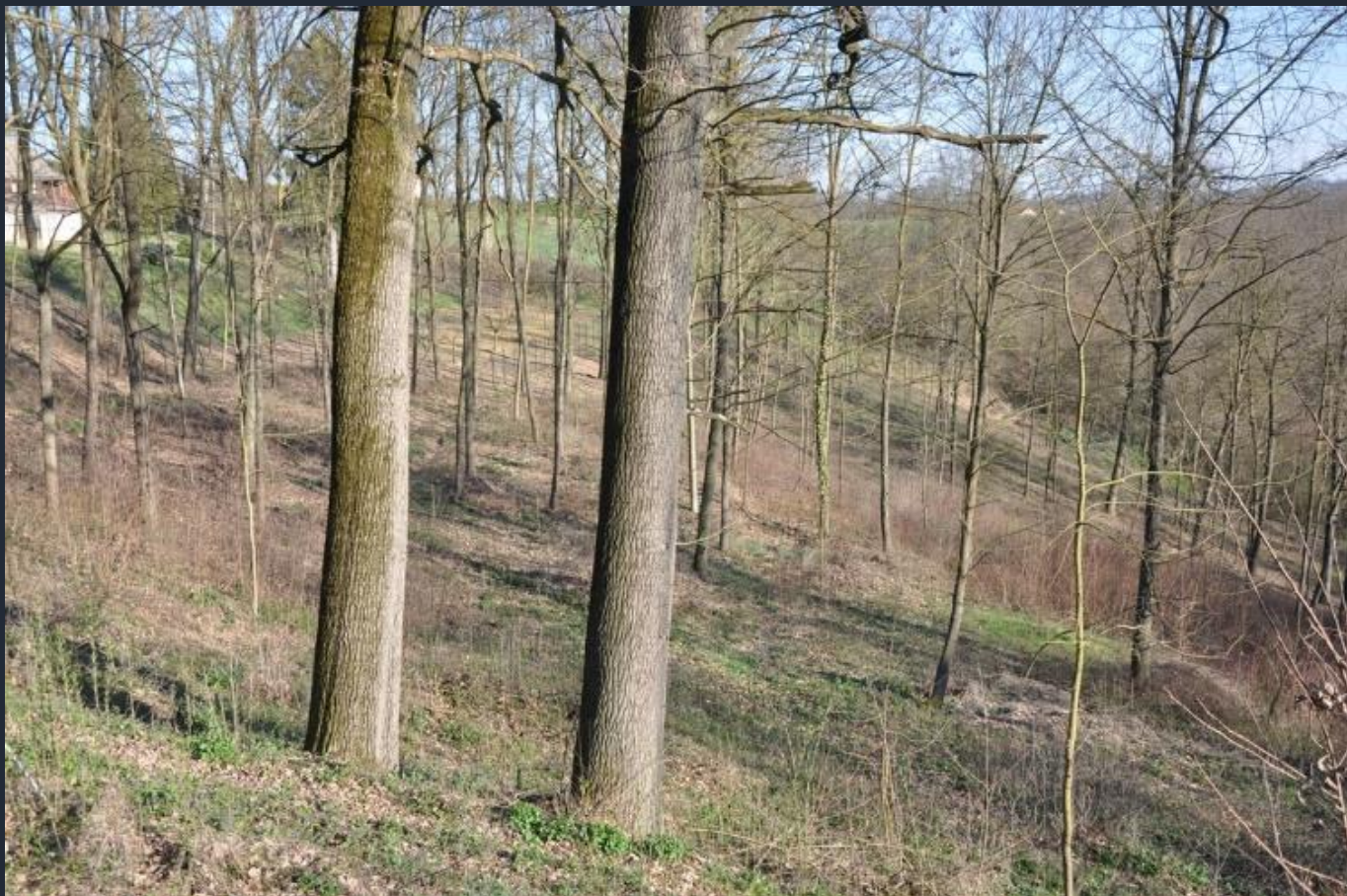
Veduta di alcune Farnie (Quercus robur) nel pieno del vigore giovanile