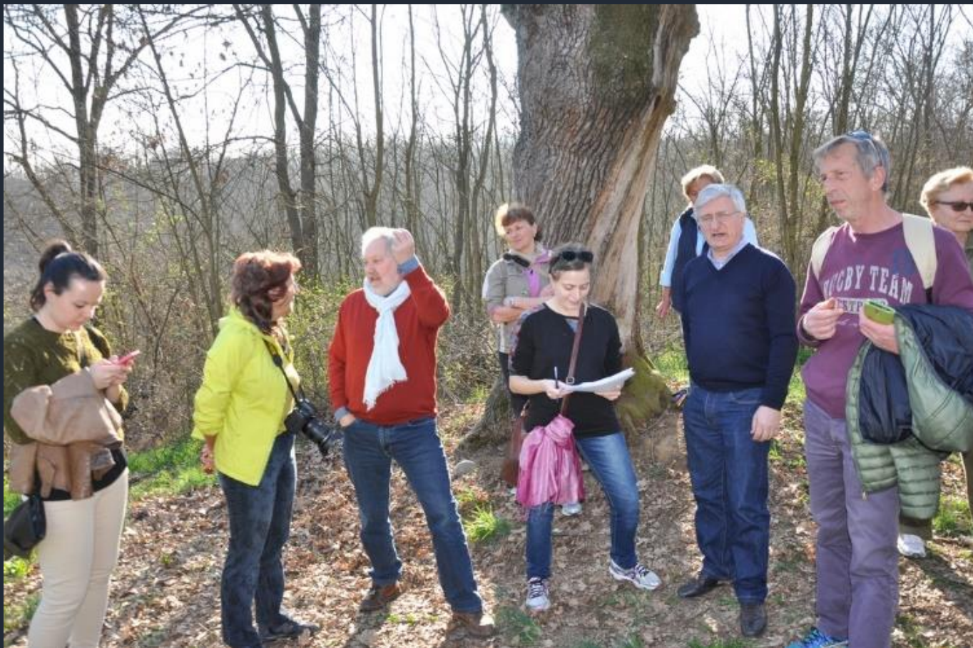
Compilazione della Scheda per la richiesta di riconoscimento del valore monumentale dell'albero ai sensi della Legge 10 del 2013