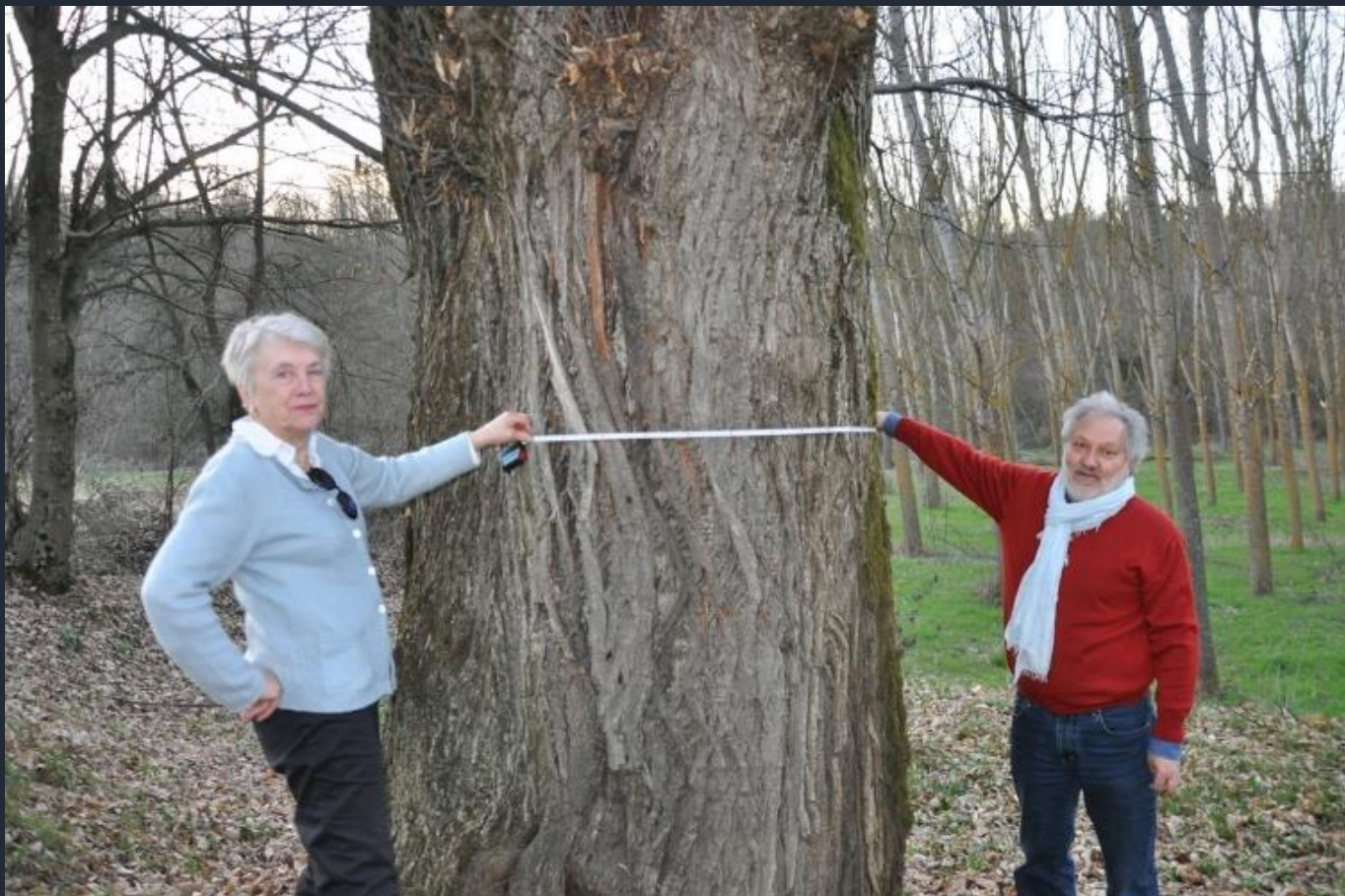
Misurazione di un Castagno monumentale (Castanea sativa) nel fondovalle di Ferrere d'Asti