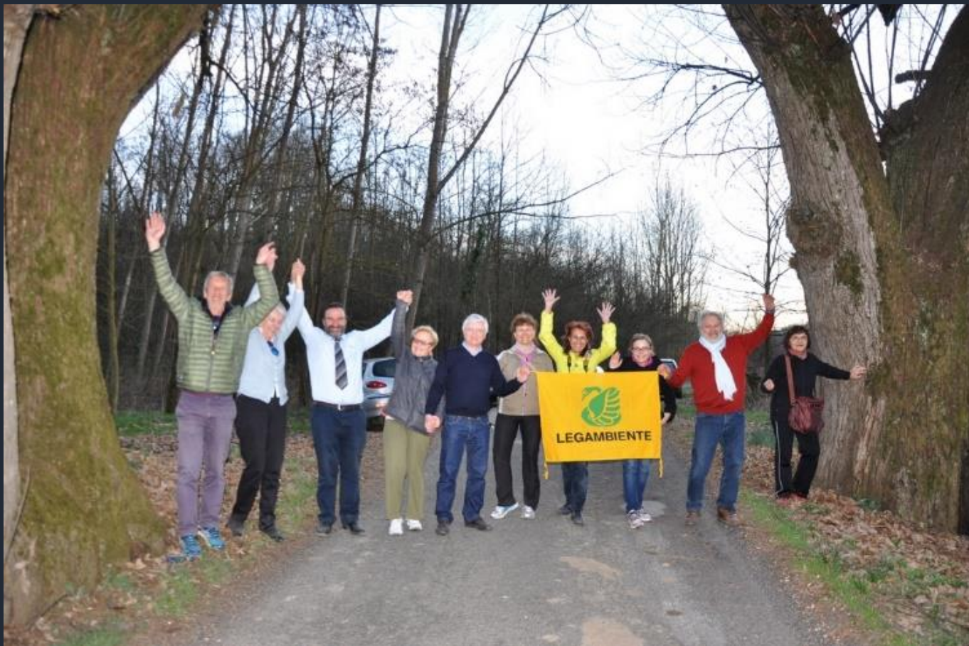
Conclusione con esultanza della camminata alla scoperta degli alberi monumentali di Villafranca d'Asti e Ferrere in occasione della prima Giornata Nazionale del Paesaggio 2017