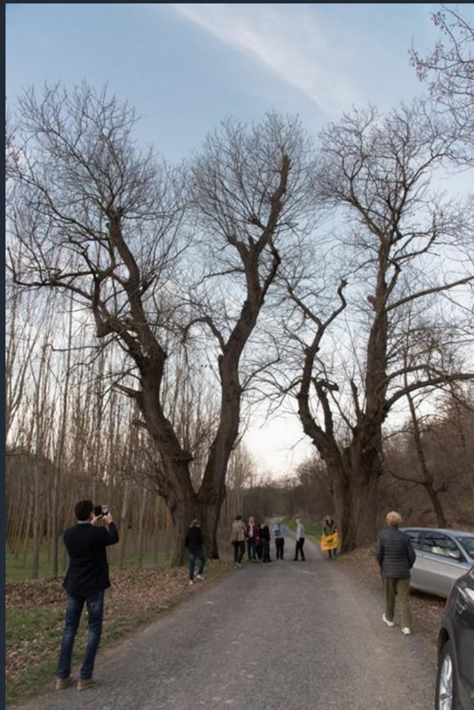
Eccezionali Castagni presenti a Ferrere d'Asti