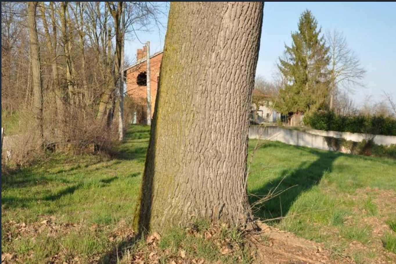
Veduta della base del fusto di un esemplare monumentale di Farnia (Quercus robur) presente nel comune di Villafranca d'Asti