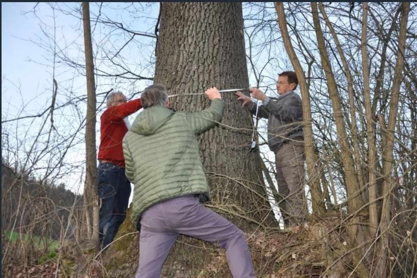
Misurazione del fusto ad altezza di petto d'uomo di una farnia a Ferrere d'Asti