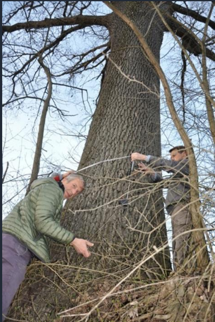
Misurazione del fusto ad altezza di petto d'uomo di una farnia a Ferrere d'Asti