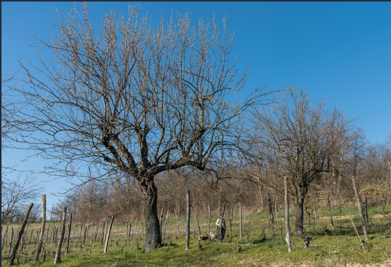
Veduta del paesaggio agrario tradizionale dell’Astigiano con vigneti ed alberi da frutto