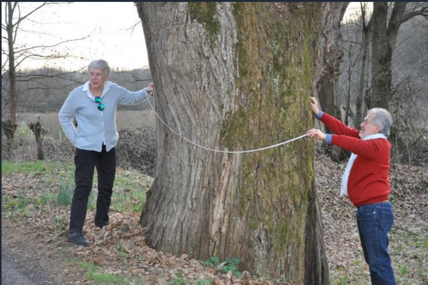
Misurazione di un Castagno monumentale (Castanea sativa) nel fondovalle di Ferrere d'Asti