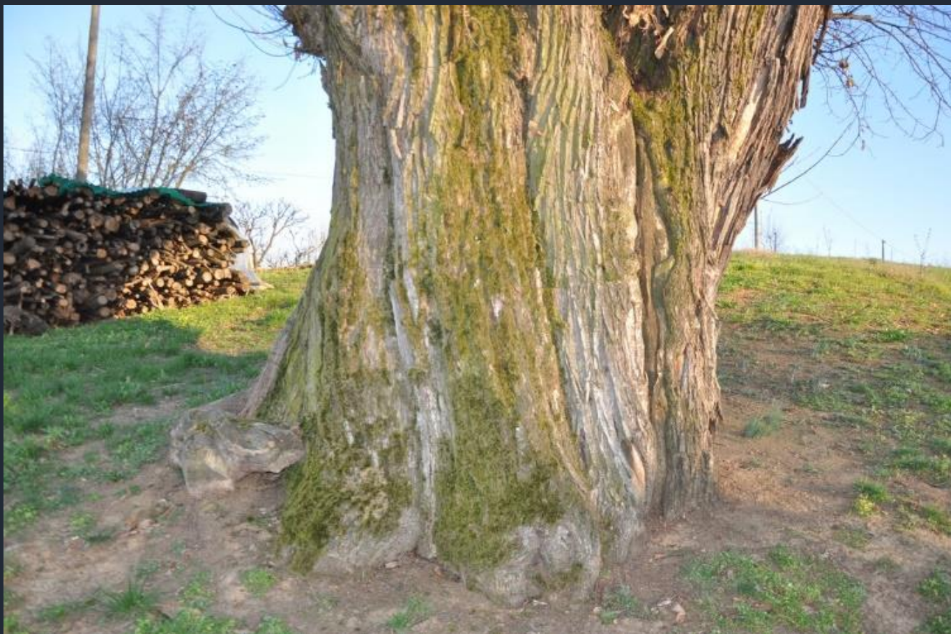
Veduta di dettaglio della base del fusto del Castagno monumentale di Ferrere