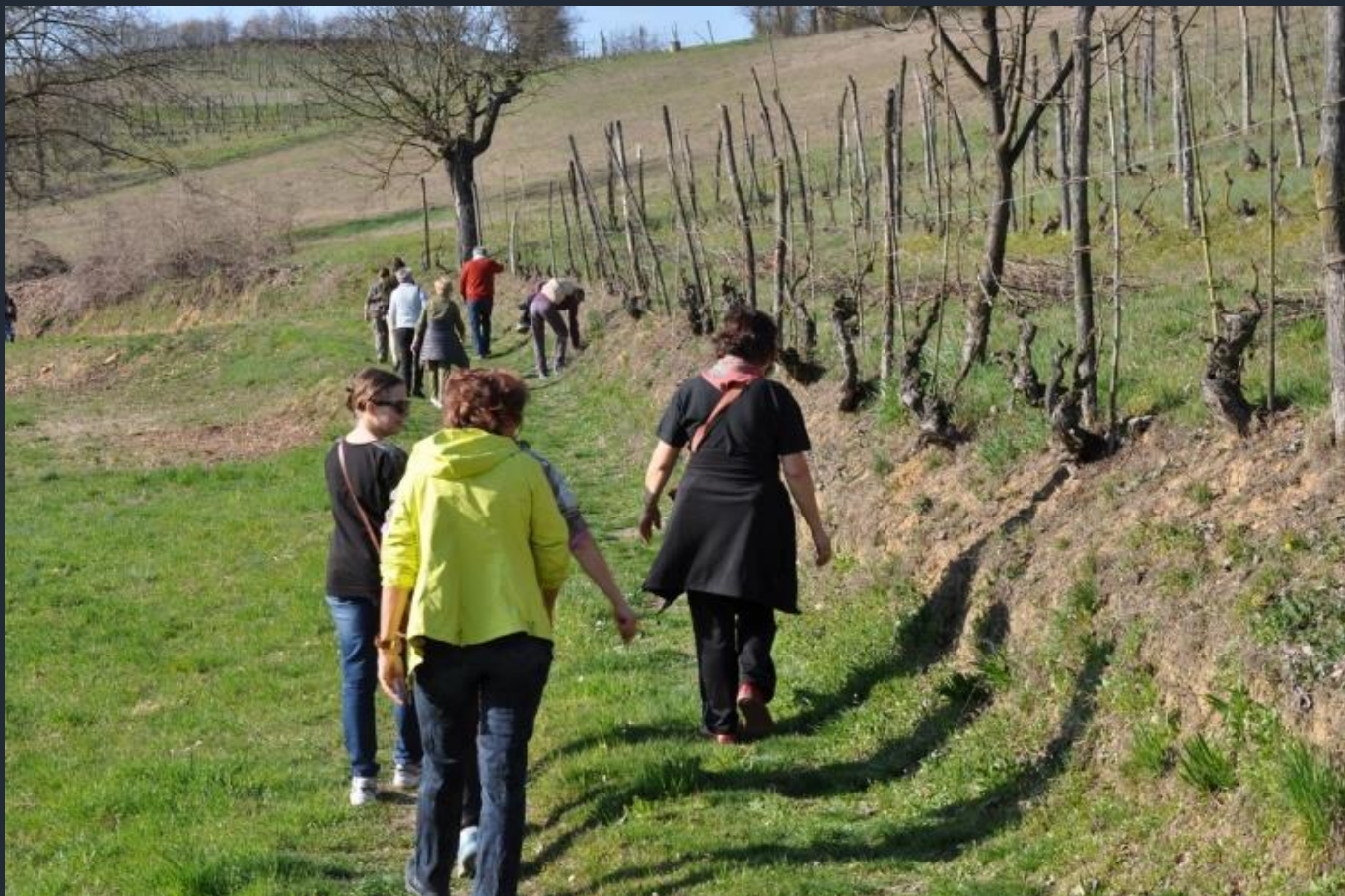
Camminata alla ricerca degli alberi monumentali nel paesaggio agrario del nord ovest dell'Astigiano