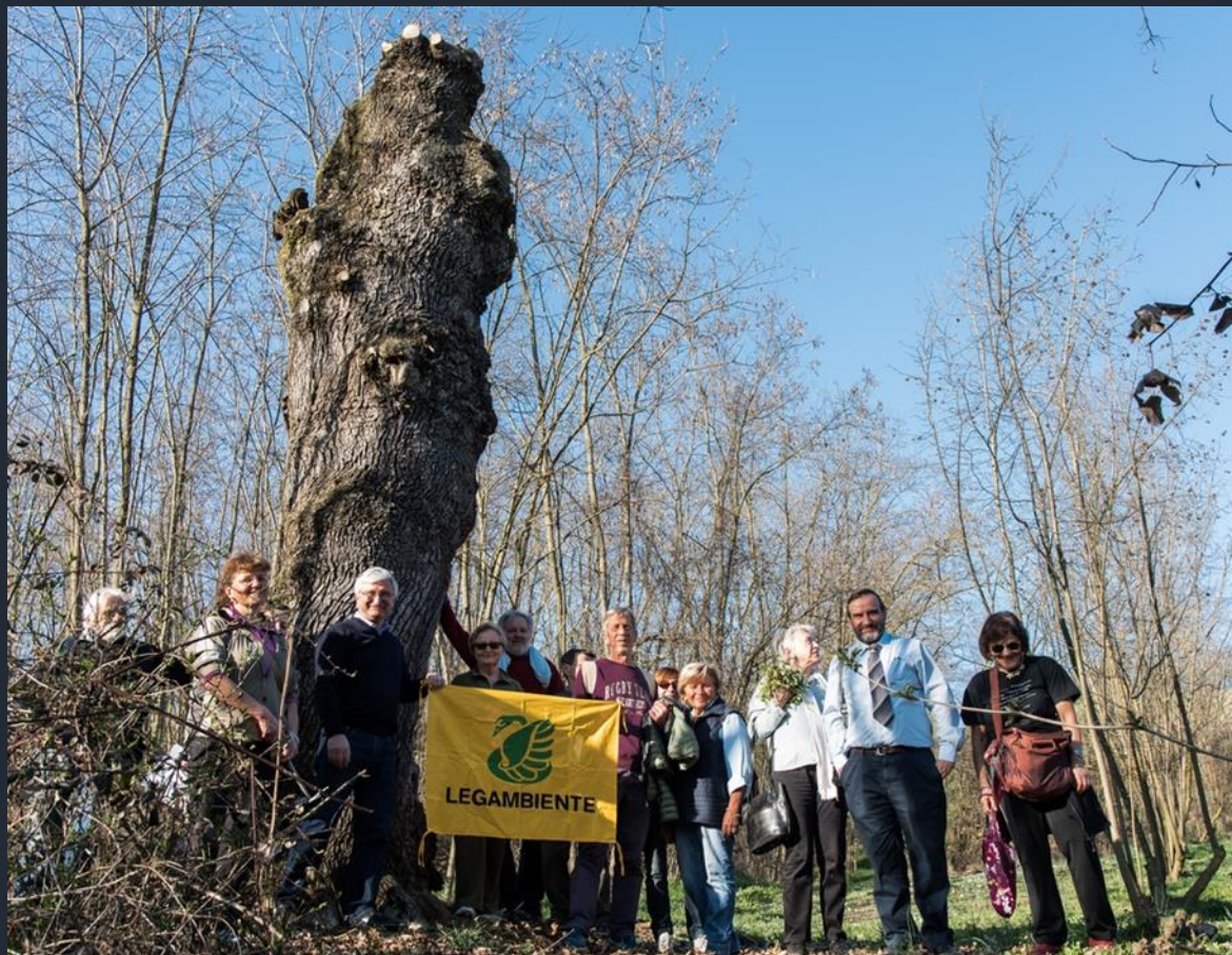
Foto ricordo con tutti i partecipanti con la bandiera di Legambiente al termine della schedatura della Quercia di Villafranca d'Asti per l'avvio del procedimento di dichiarazione del valore monumentale dell'albero ai sensi della Legge 10 del 2013