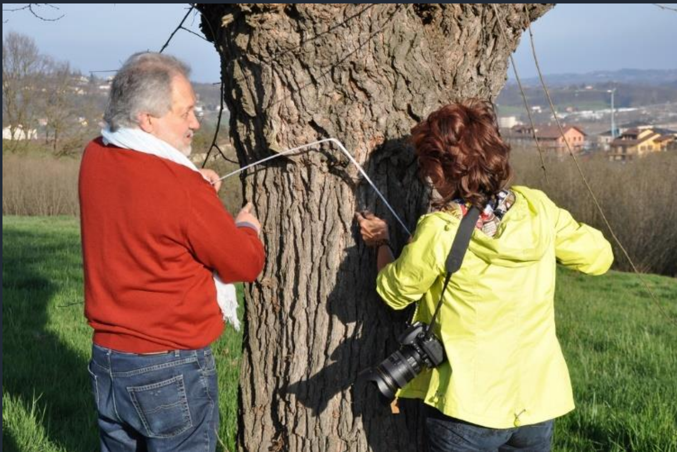
Misurazione della circonferenza del fusto del gelso per la compilazione della scheda di richiesta di dichiarazione del valore monumentale dell'albero