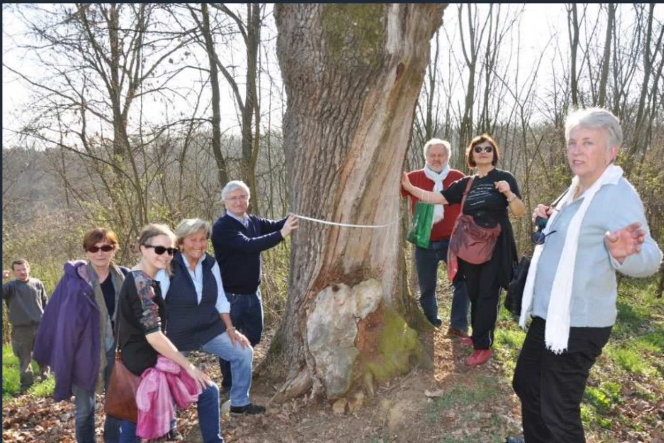
Misurazione della circonferenza del fusto dell'albero monumentale all'altezza canonica del petto d'uomo