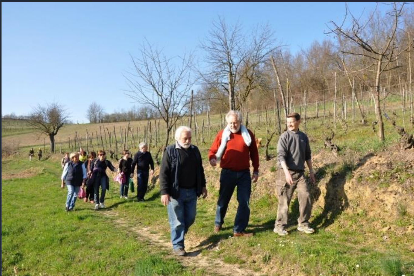
Camminata alla ricerca degli alberi monumentali nel paesaggio agrario del nord ovest dell'Astigiano