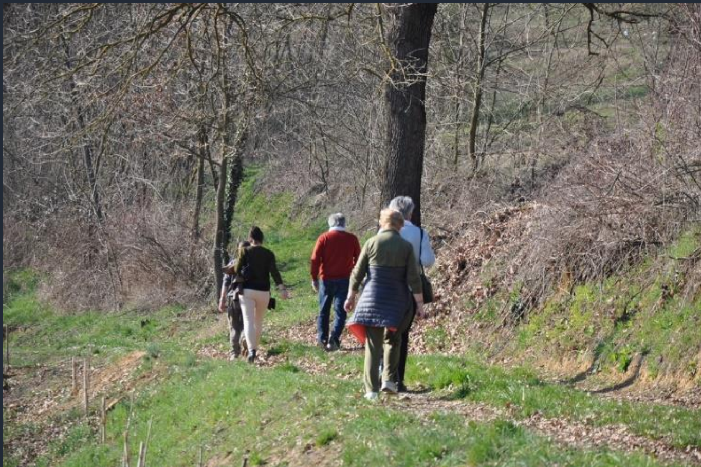
Camminata alla ricerca degli alberi monumentali nel paesaggio agrario del nord ovest dell'Astigiano