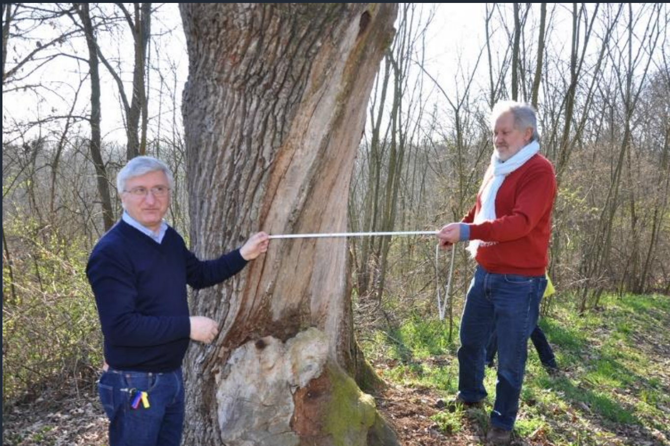
Misurazione della circonferenza del fusto dell'albero monumentale all'altezza canonica del petto d'uomo