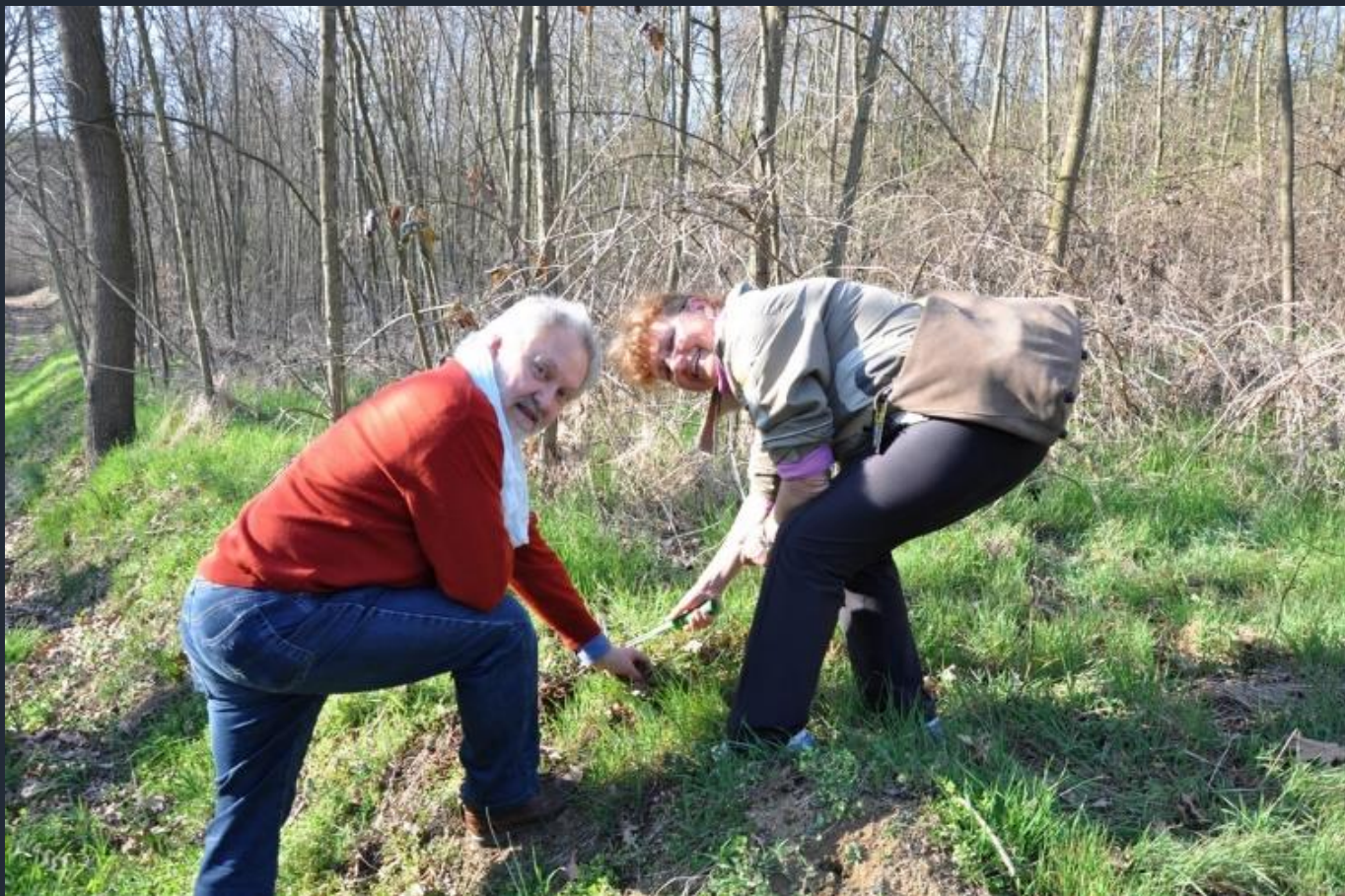
Avvenuto interrimento della ghianda della Quercia (Quercus robur)