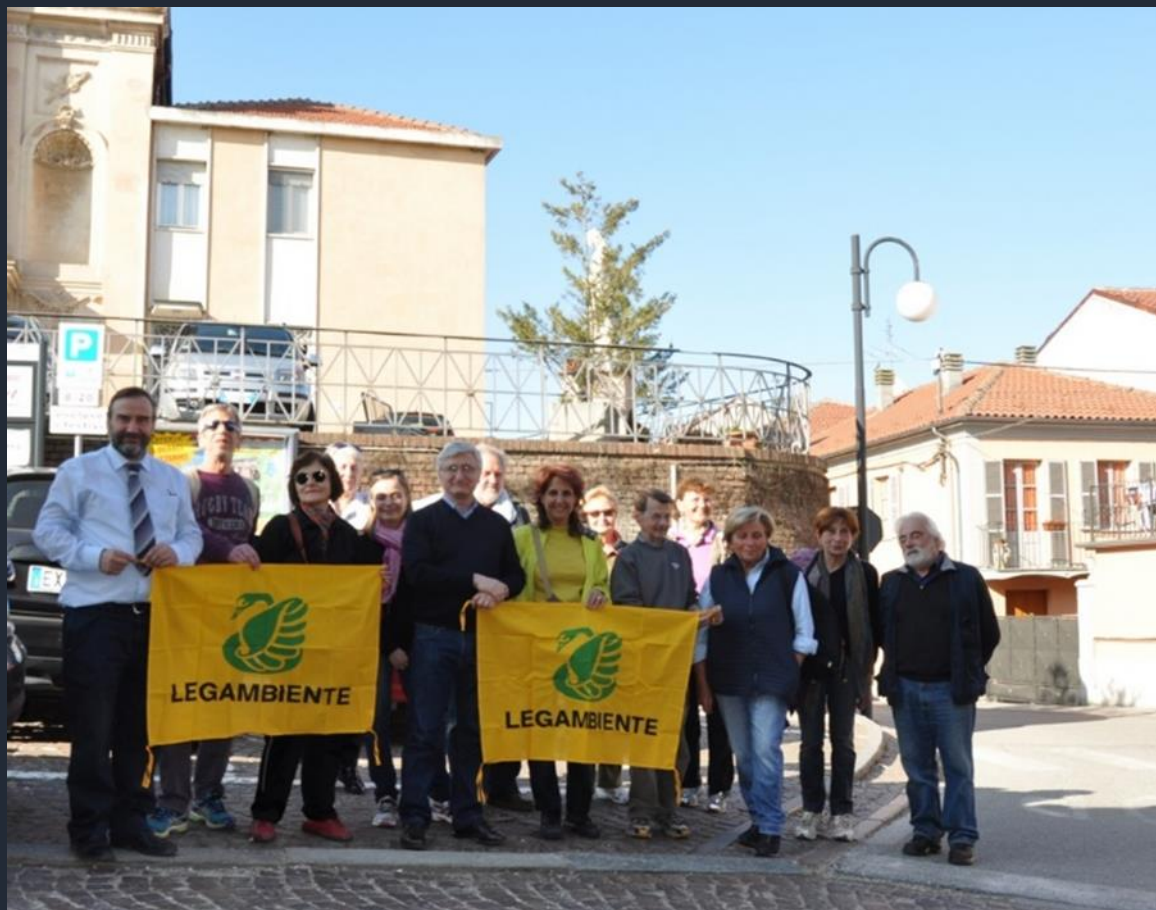
Avvio della camminata nelle campagne di Villafranca d'Asti e Ferrere alla ricerca degli alberi monumentali, quali elementi peculiari del paesaggio astigiano