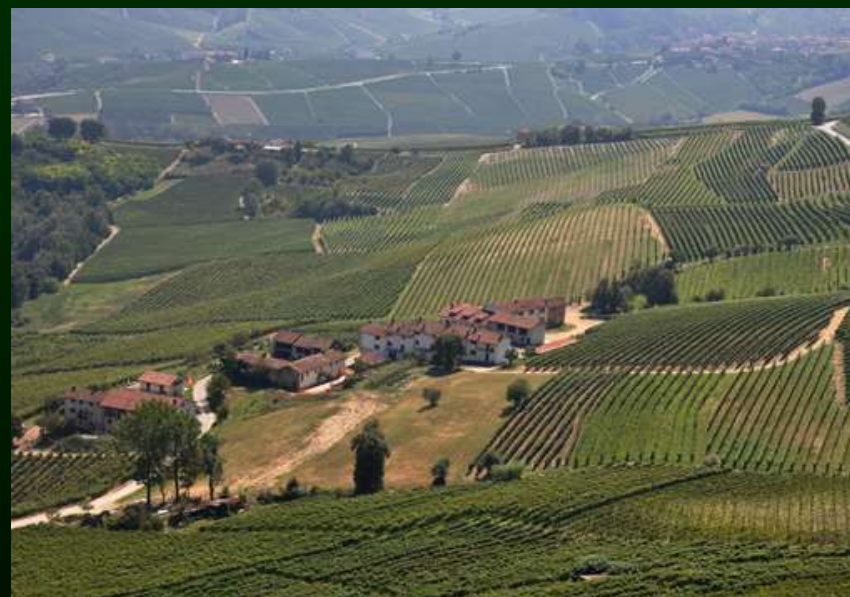
La Morra (CN)