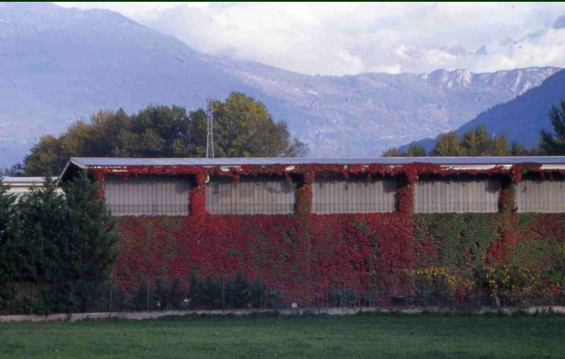
Capannone rinverdito con l'impiego della specie Parthenocissus tricuspidata