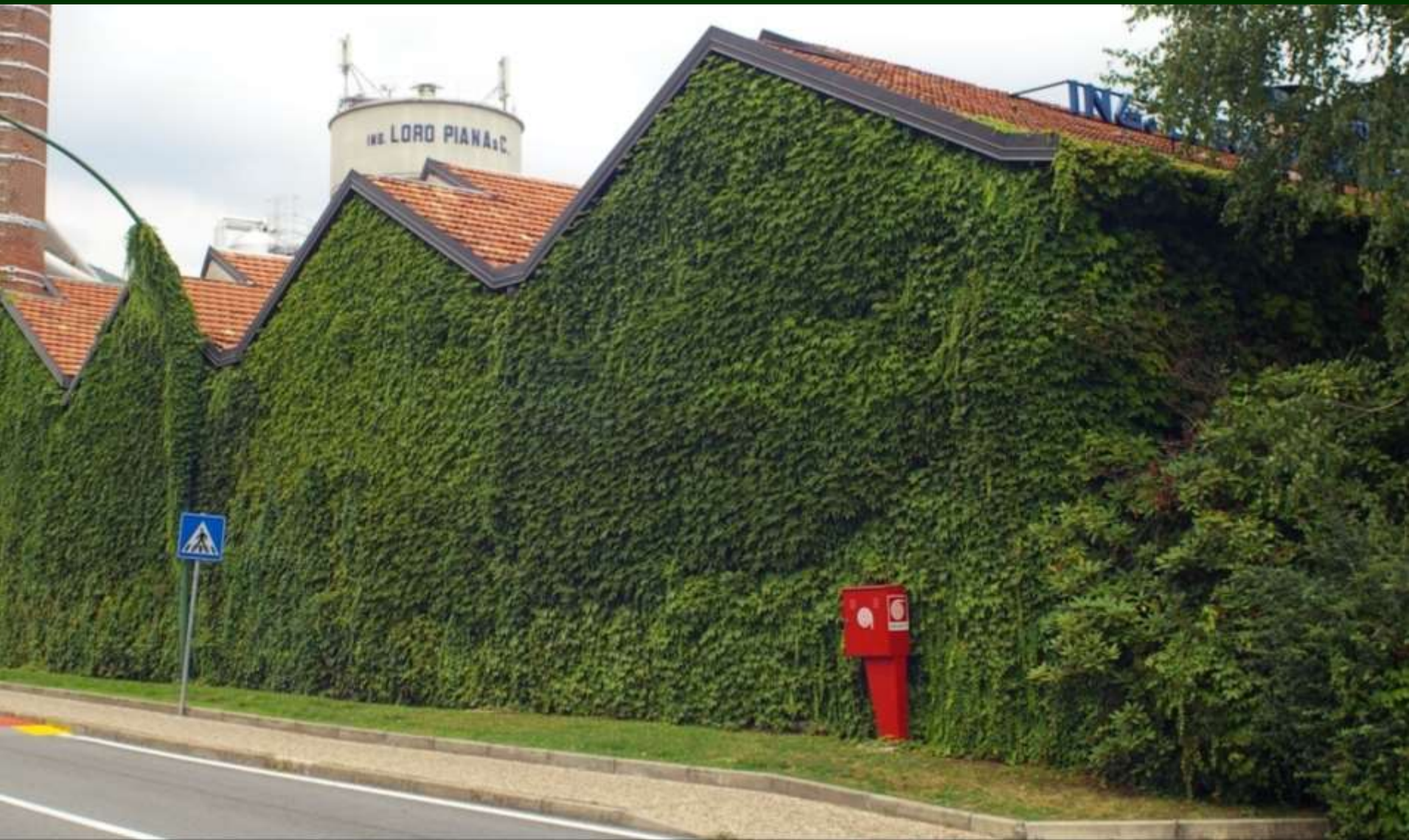
Capannone rinverdito con l'impiego della specie Parthenocissus tricuspidata