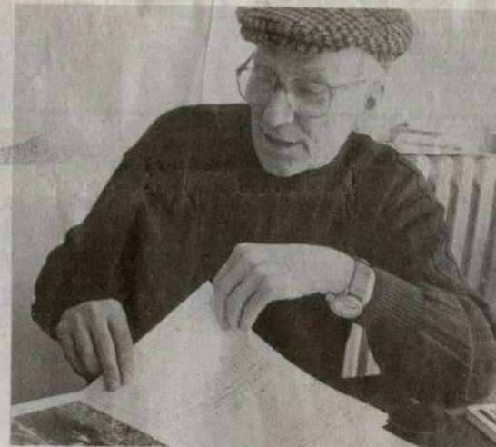
Bartolo Mascarello, figura storica del Barolo