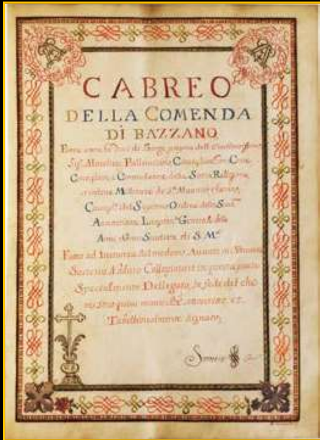
Frontespizio del cabreo della Commenda Bazzana, 1716. AOM, Mappe e Cabrei, Cabrei Saluzzo 1.*

FARINA A., 2002, Ecologia del paesaggio: principi, metodi e applicazioni .