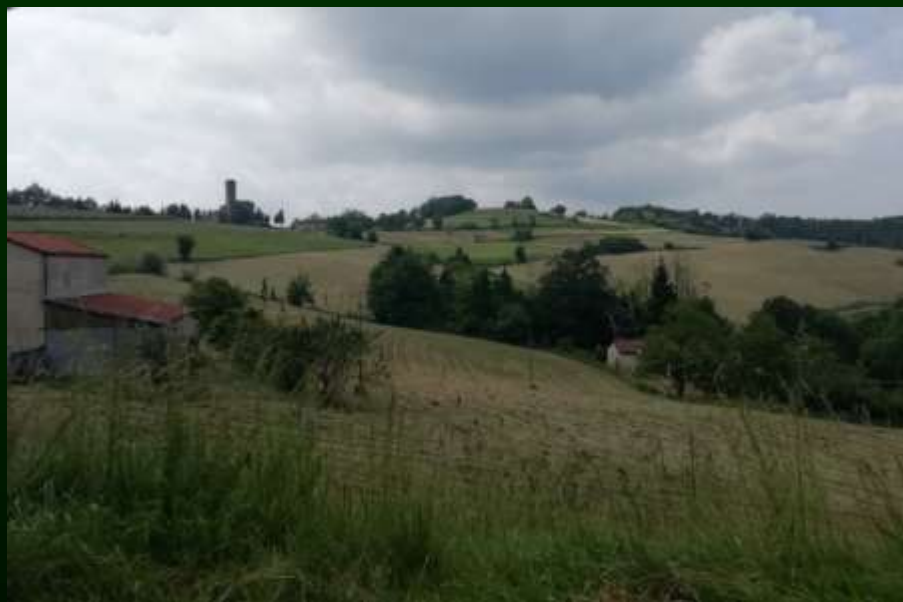
Niella Belbo (CN)