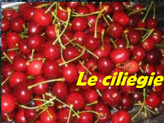
Le ciliegie di Revigliasco d'Asti