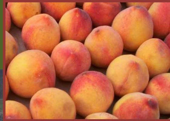
Le pesche limonine di Asti